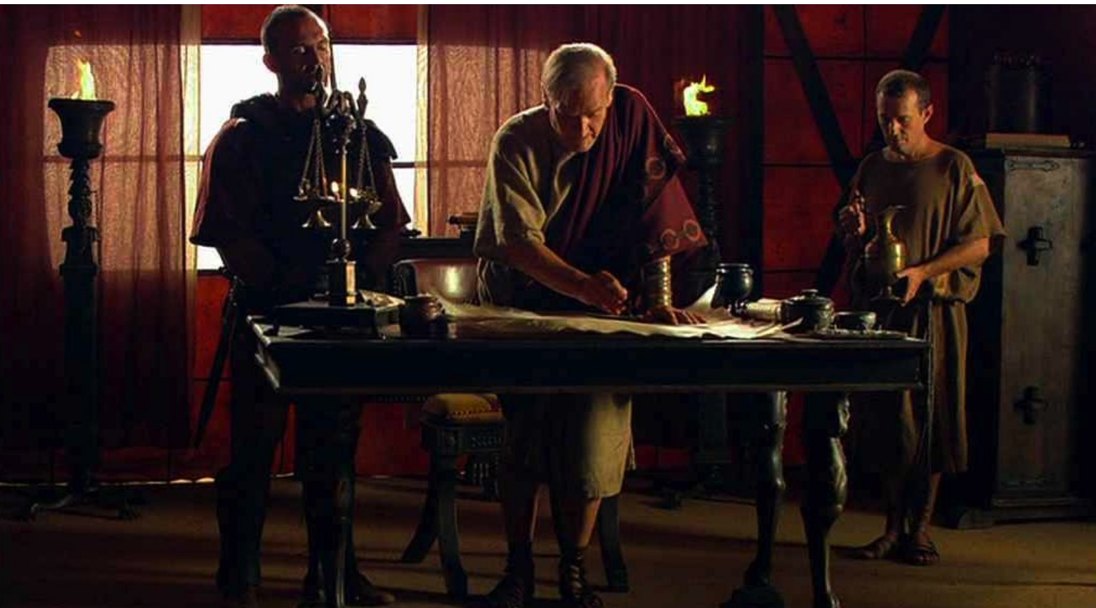
Hispania, la Leyenda : qui travaille sous sa tente.