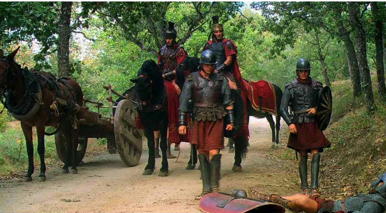
Hispania, la Leyenda : comme Marco peut le constater avec plaisir.