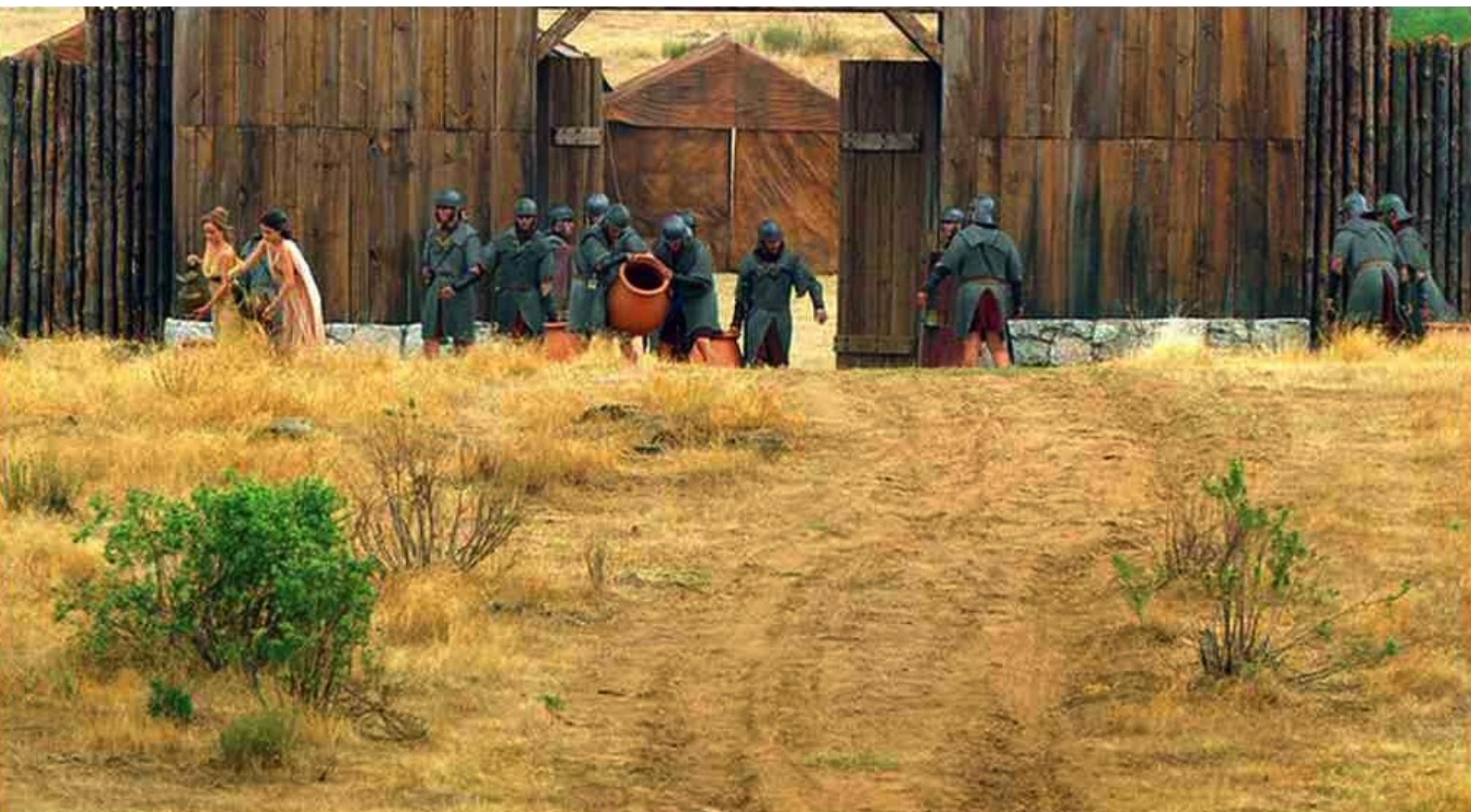
Hispania, la Leyenda : Les légionnaires vident donc les amphores,