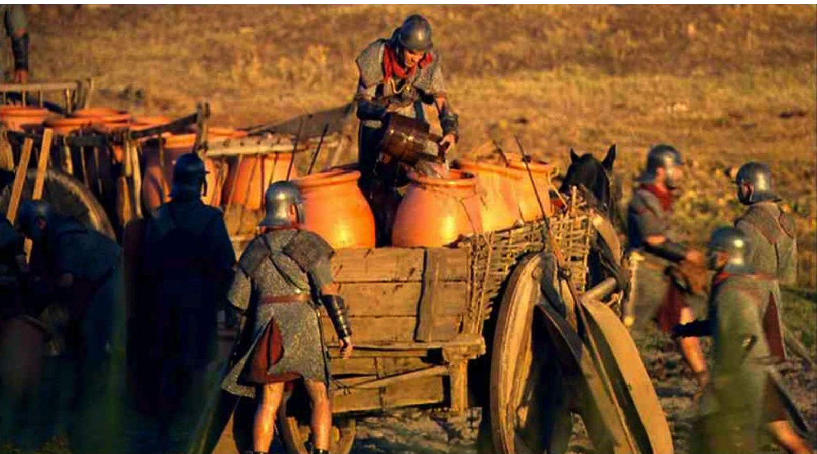
Hispania, la Leyenda : ils puissent les remplir d'eau.