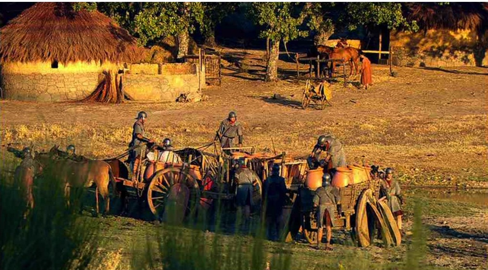
Hispania, la Leyenda : pour que, allant au lac,