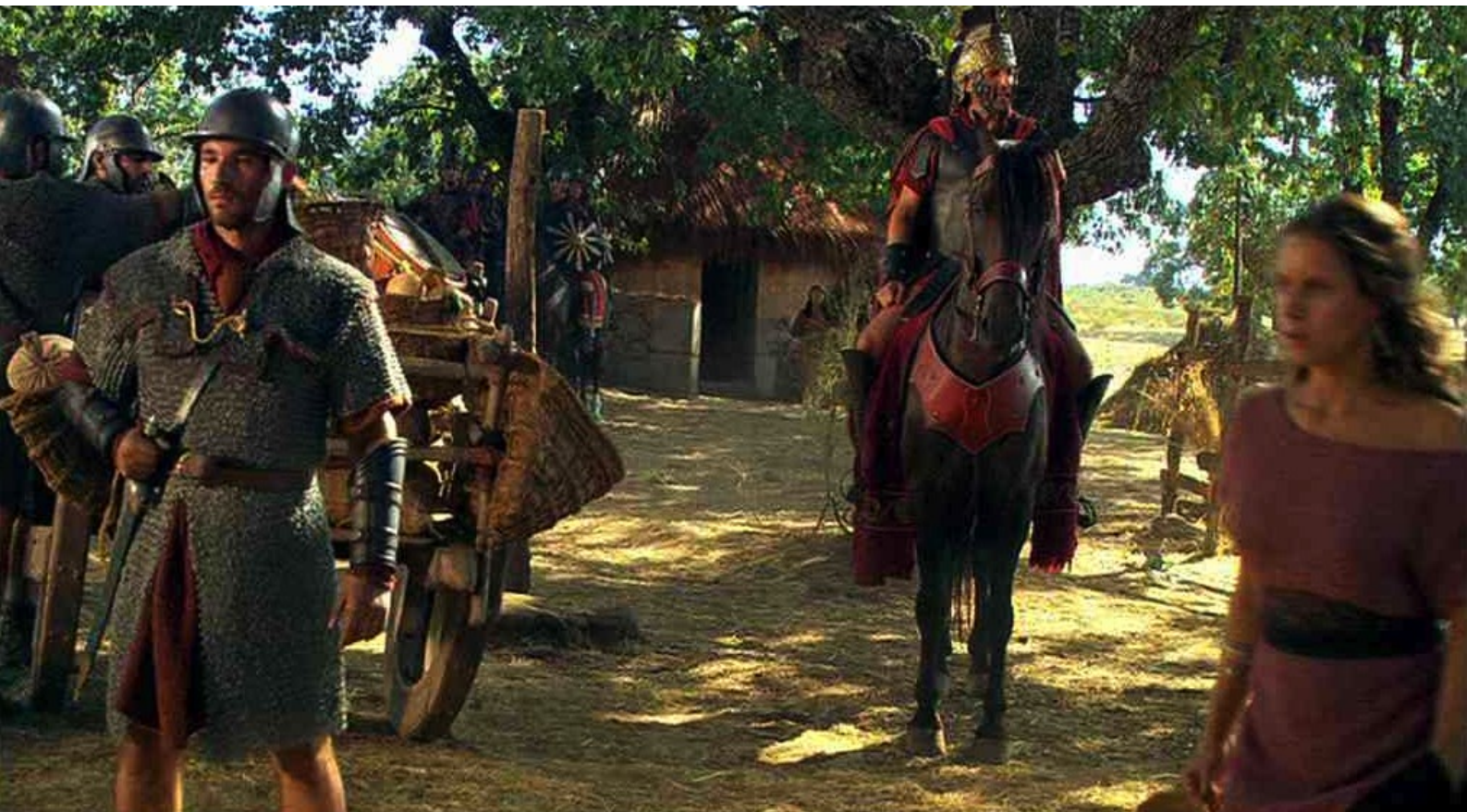
Hispania, la Leyenda : qu'ils emportent sur des chars...