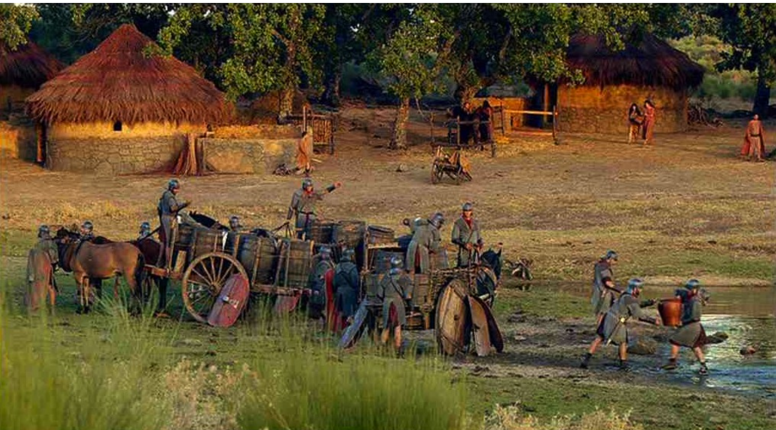
Hispania, la Leyenda : Galba envoie des soldats puiser de l'eau au lac...