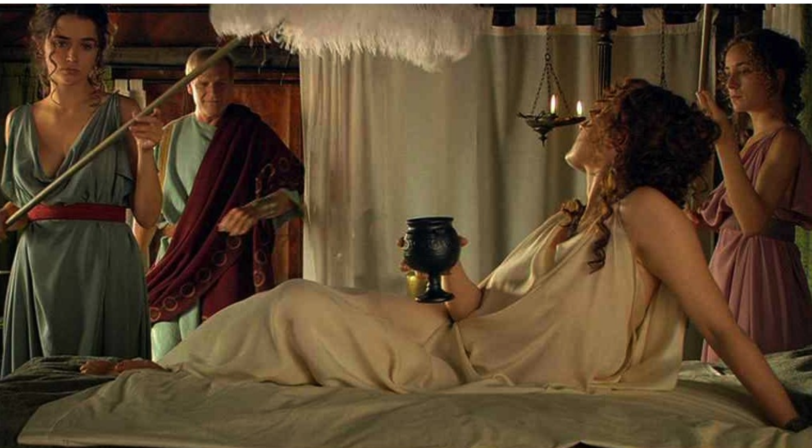
Hispania, la Leyenda : Galba va gifler Claudia, qui l'a trompé en identifiant Viriate ;