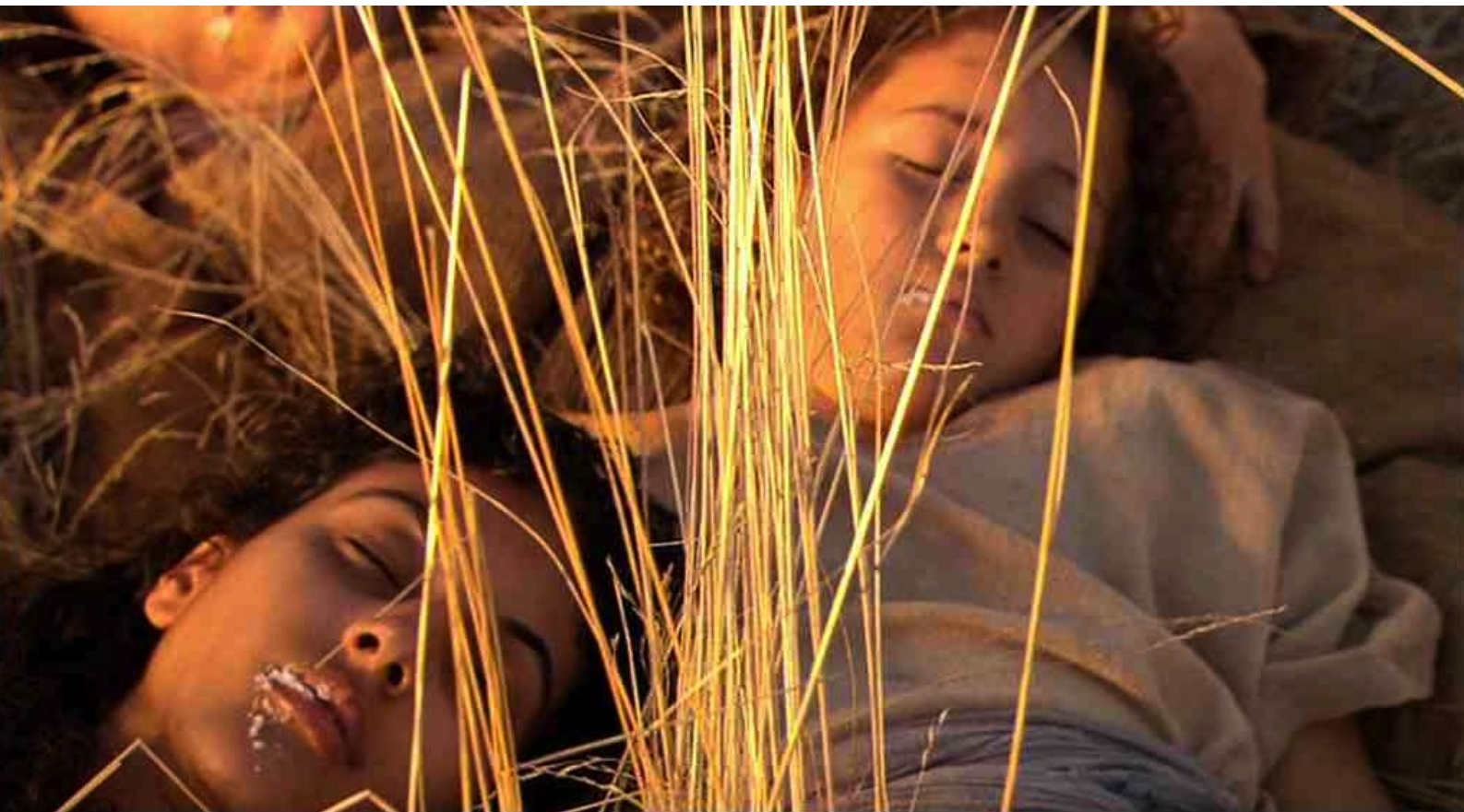
Hispania, la Leyenda : Courant vers la famille paysanne, ils la trouvent décimée.