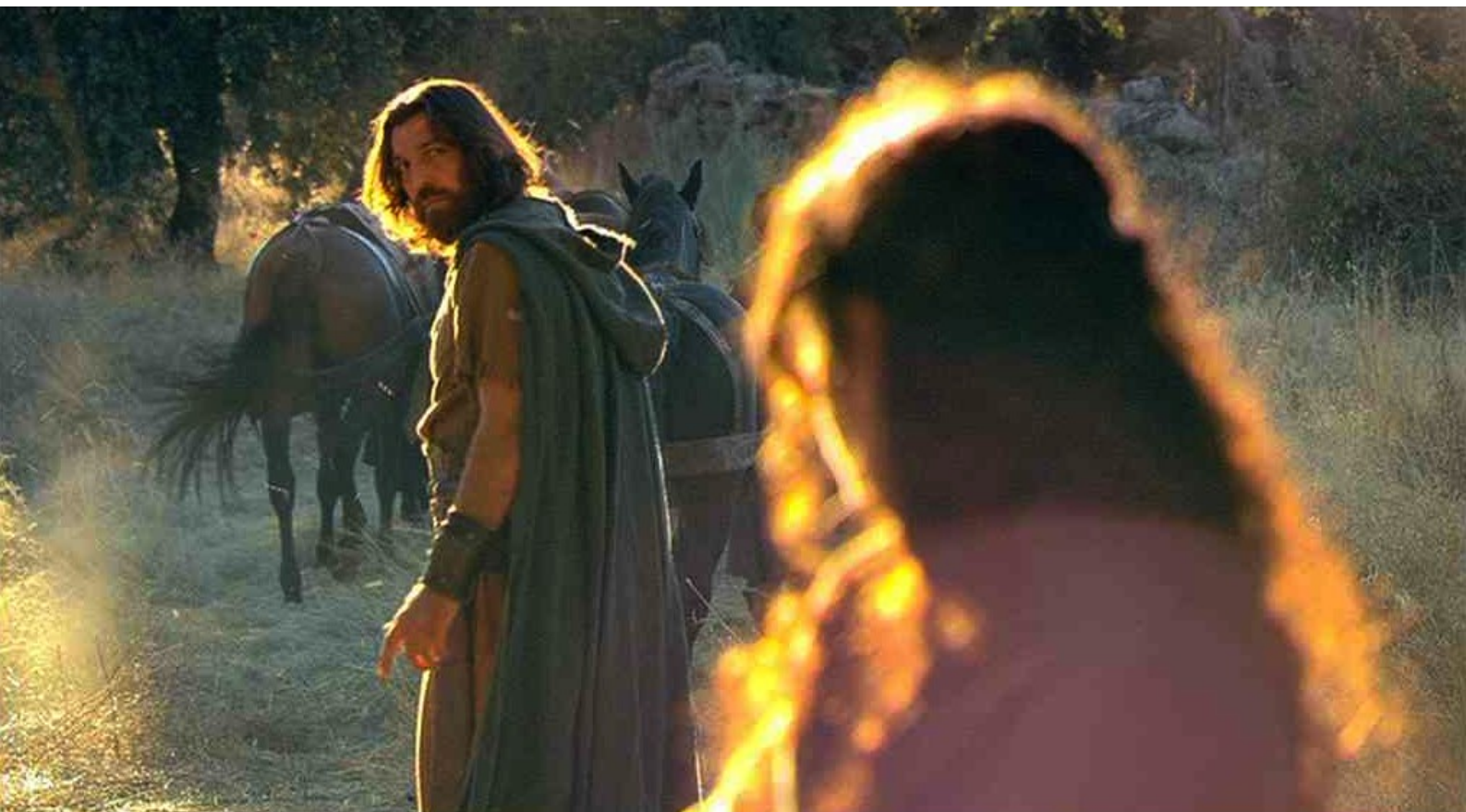
Hispania, la Leyenda : Sandro apporte le butin à Bárbara,