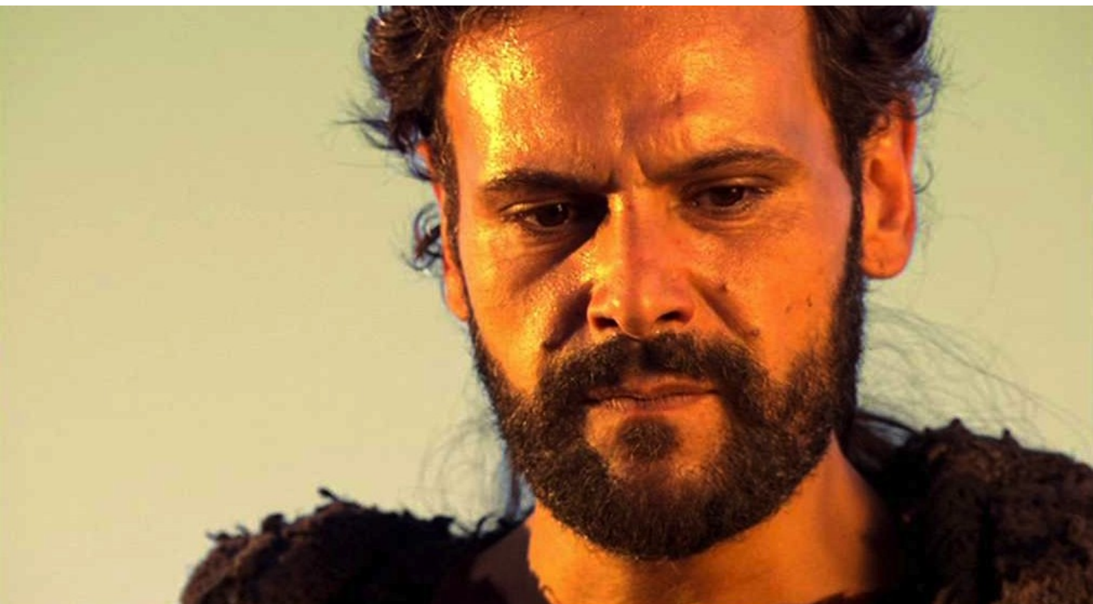
Hispania, la Leyenda : de Viriate,