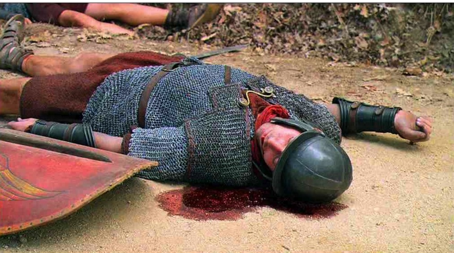
Hispania, la Leyenda : pour que les rebelles prennent la nourriture après avoir massacré les soldats,