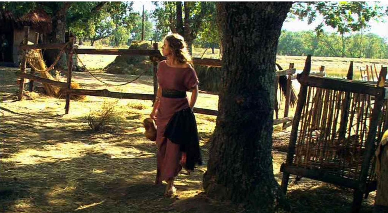
Hispania, la Leyenda : où Helena, attirée par l'attroupement,