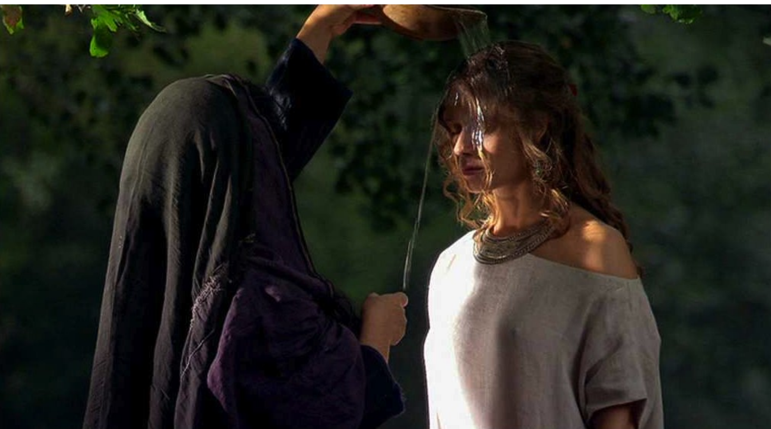
Hispania, la Leyenda : sa tête sera arrosée d'eau...