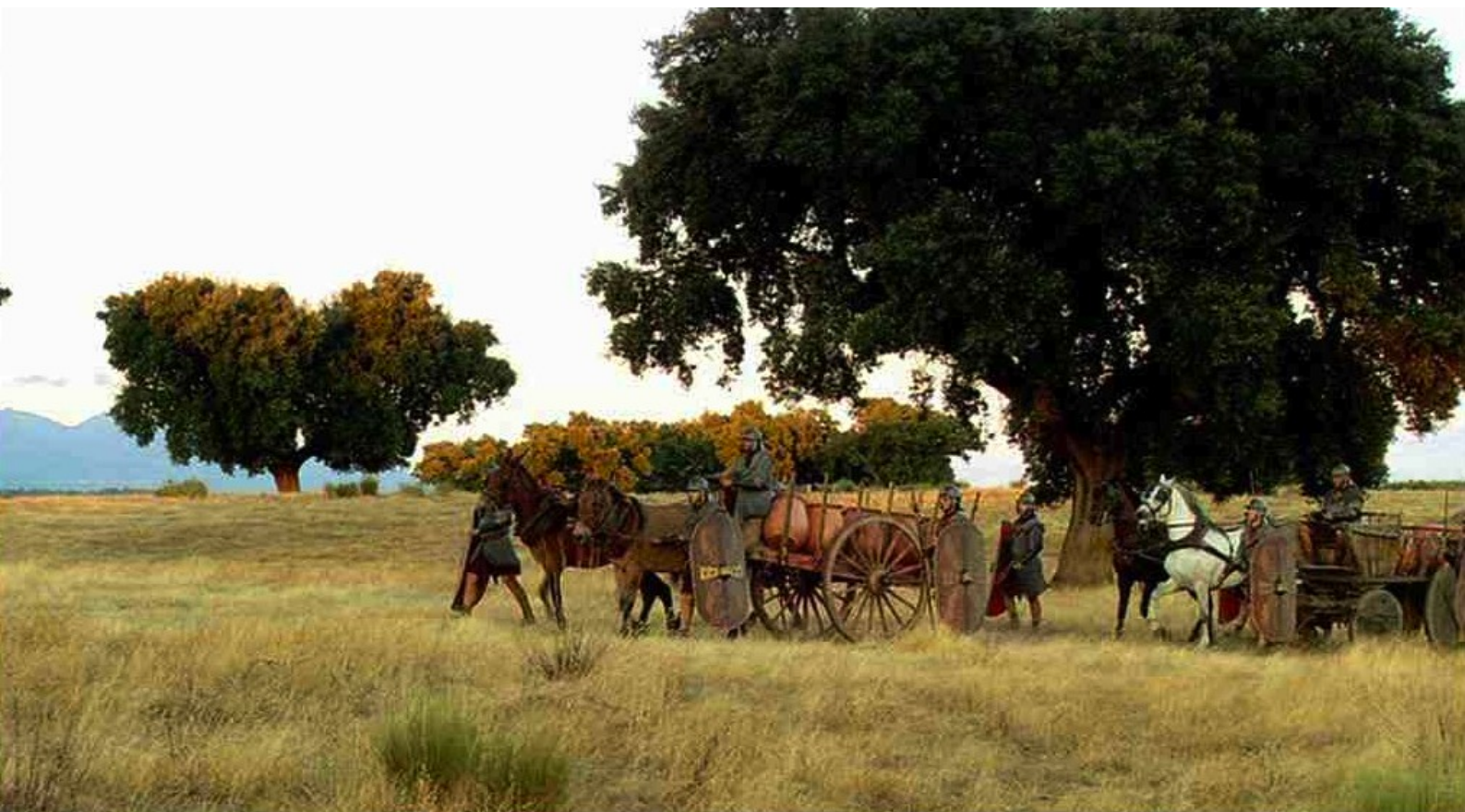
Hispania, la Leyenda : qui voient les amphores empoisonnées convoyées au camp.