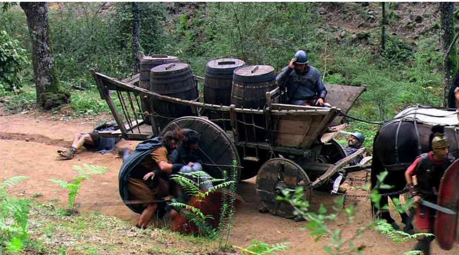
Hispania, la Leyenda : de tous côtés...