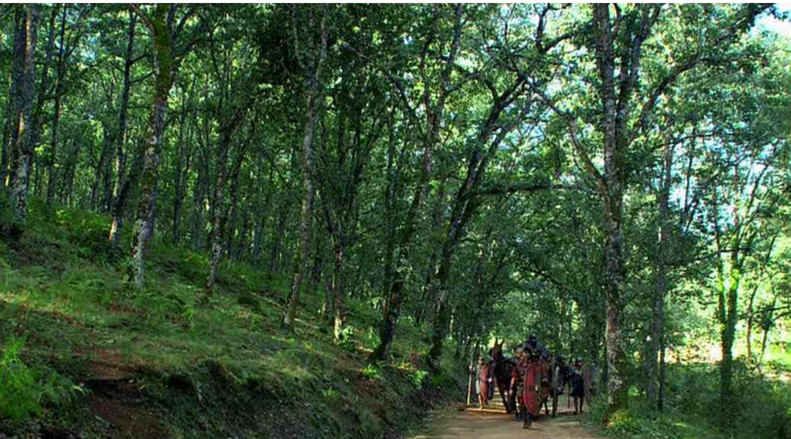
Hispania, la Leyenda : sur une route étroite et escarpée ;