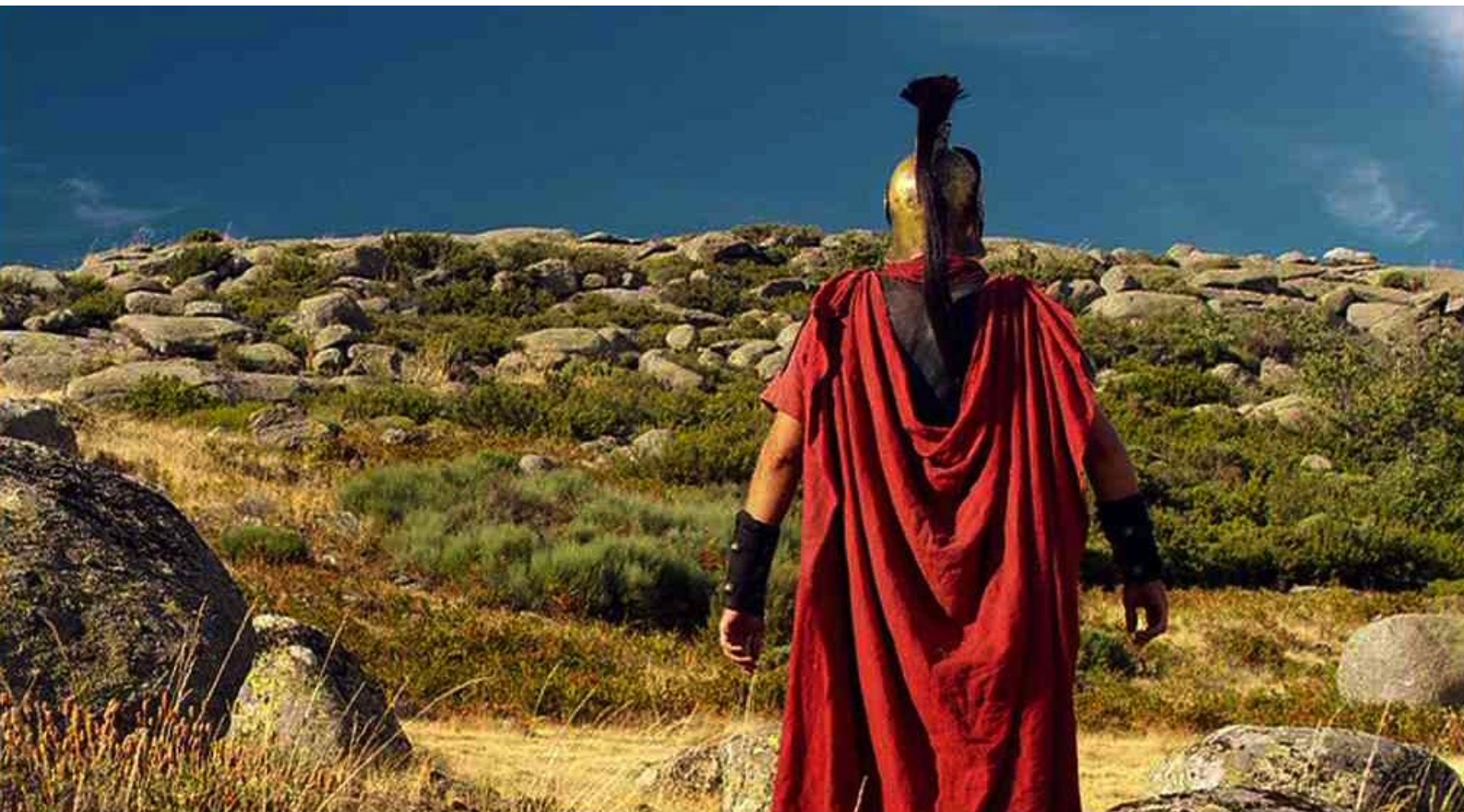
Hispania, la Leyenda : et voit avec dépit sa proie lui échapper.