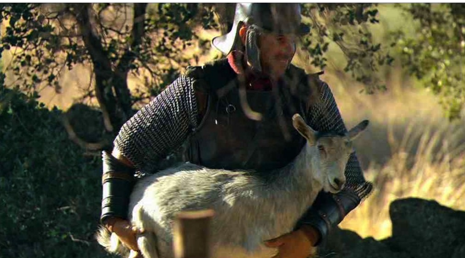
Hispania, la Leyenda : et réquisitionner chez les Lusitaniens de la nourriture...