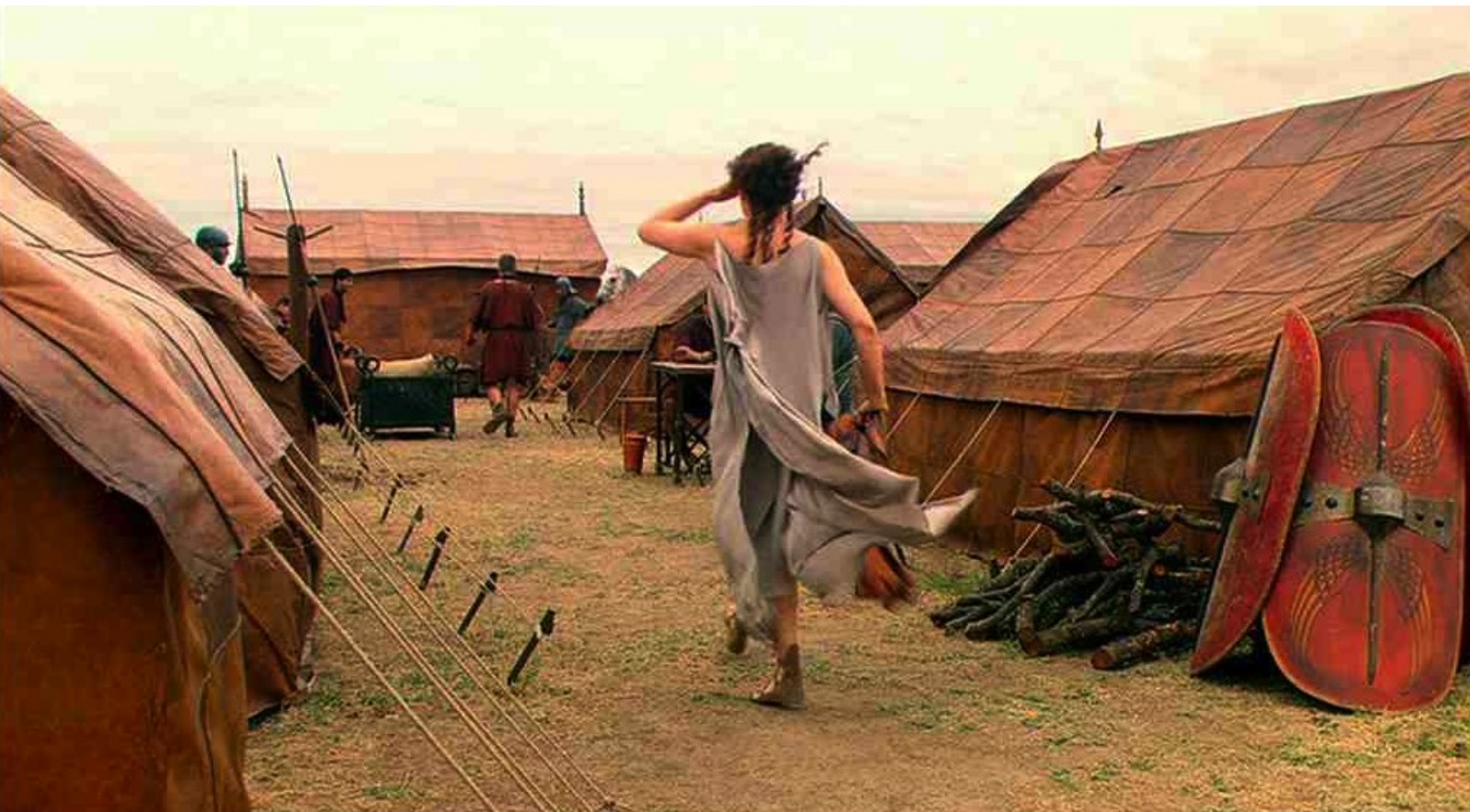
Hispania, la Leyenda : Claudia, furieuse, va se plaindre à son mari...