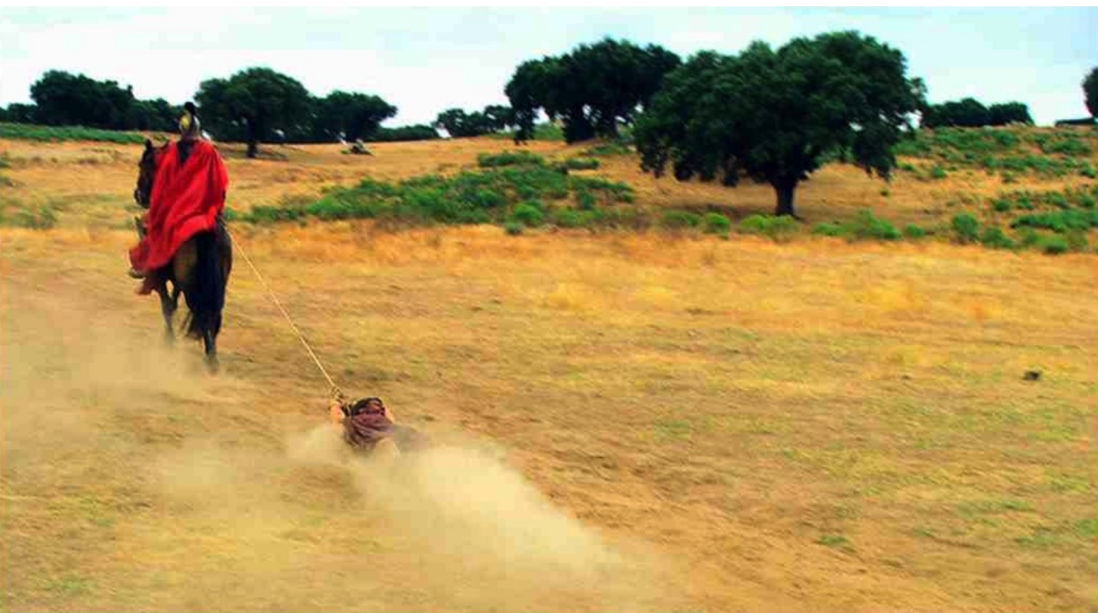
Hispania, la Leyenda : et fait traîner sons cadavre jusqu'à Caura,