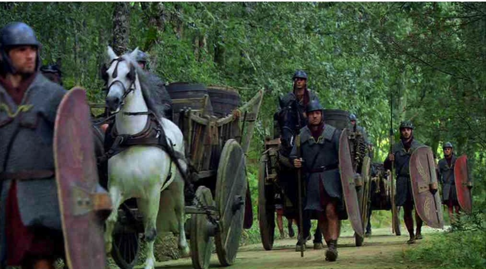
Hispania, la Leyenda : à travers la forêt...