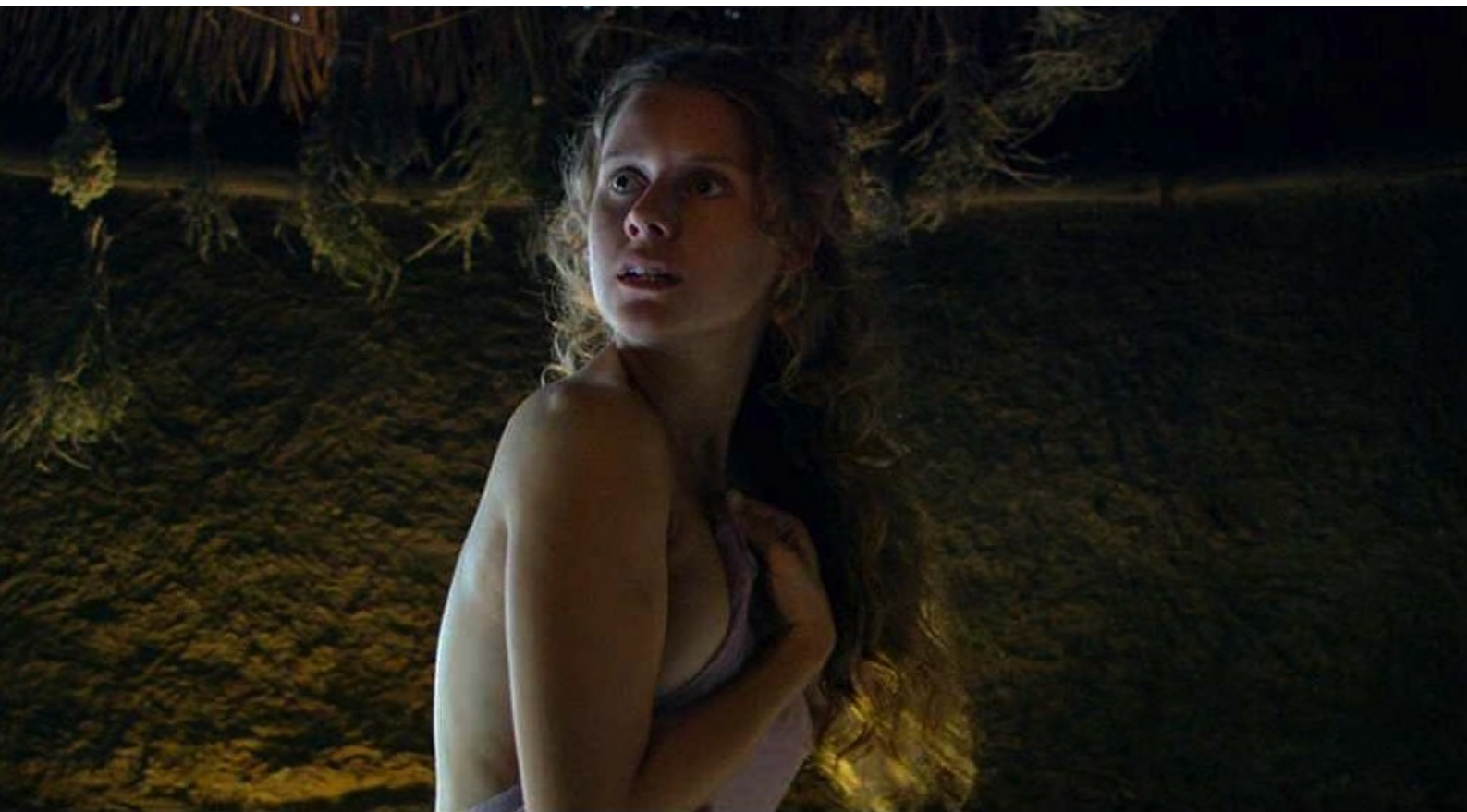
Hispania, la Leyenda : Mais maintenant, au moment de se coucher,