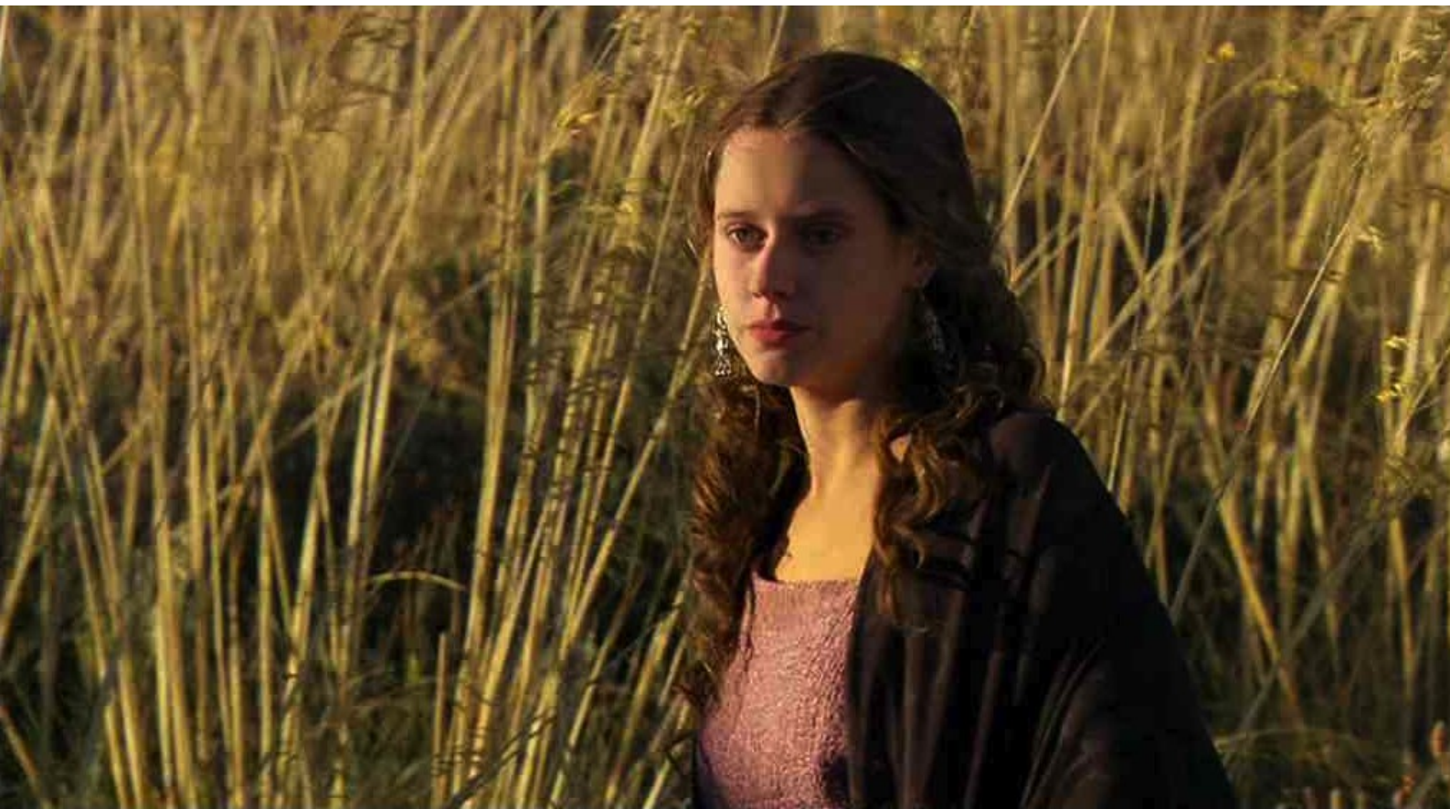
Hispania, la Leyenda : qu'une jeune femme va attendre le chef des rebelles...