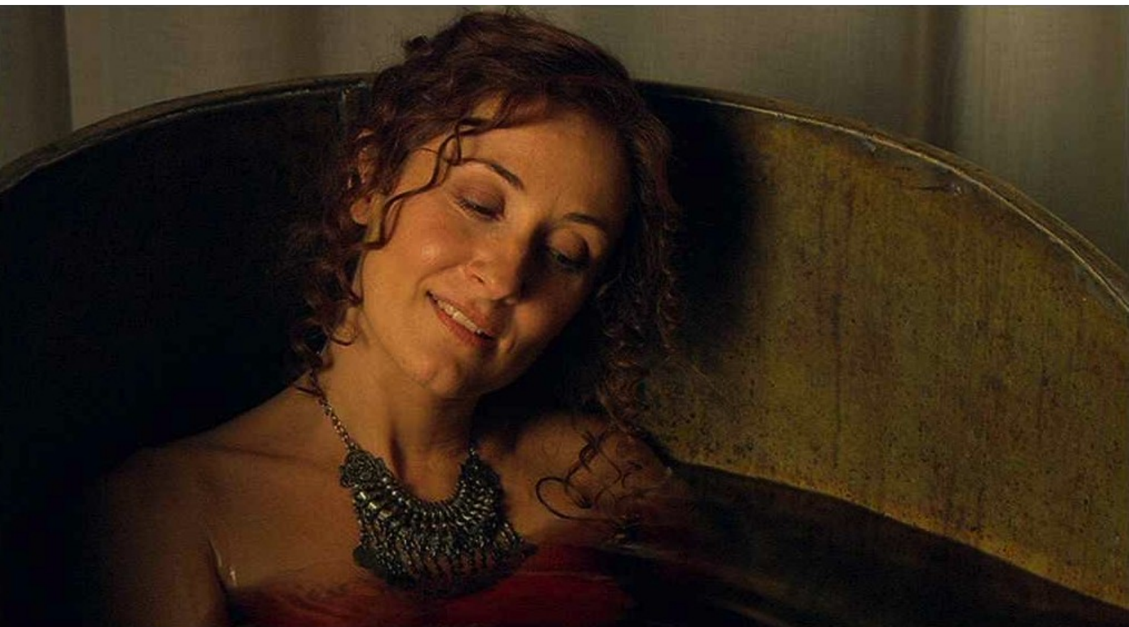
Hispania, la Leyenda : et préfère dès lors se baigner dans du vin.