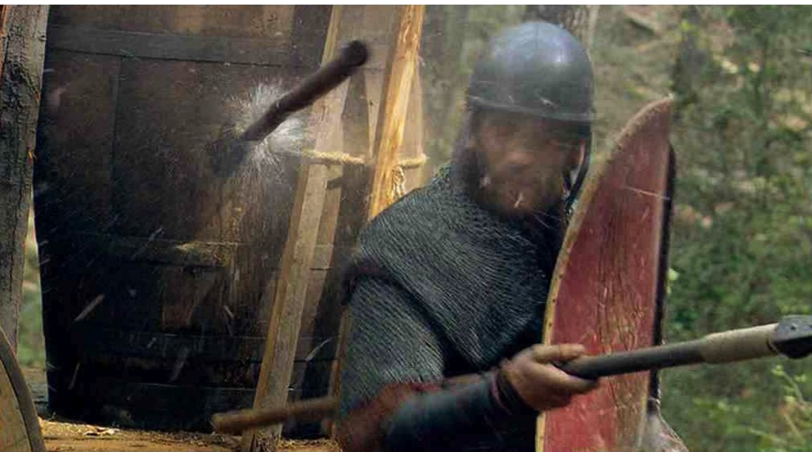
Hispania, la Leyenda : tandis que les barriques sont défoncées...