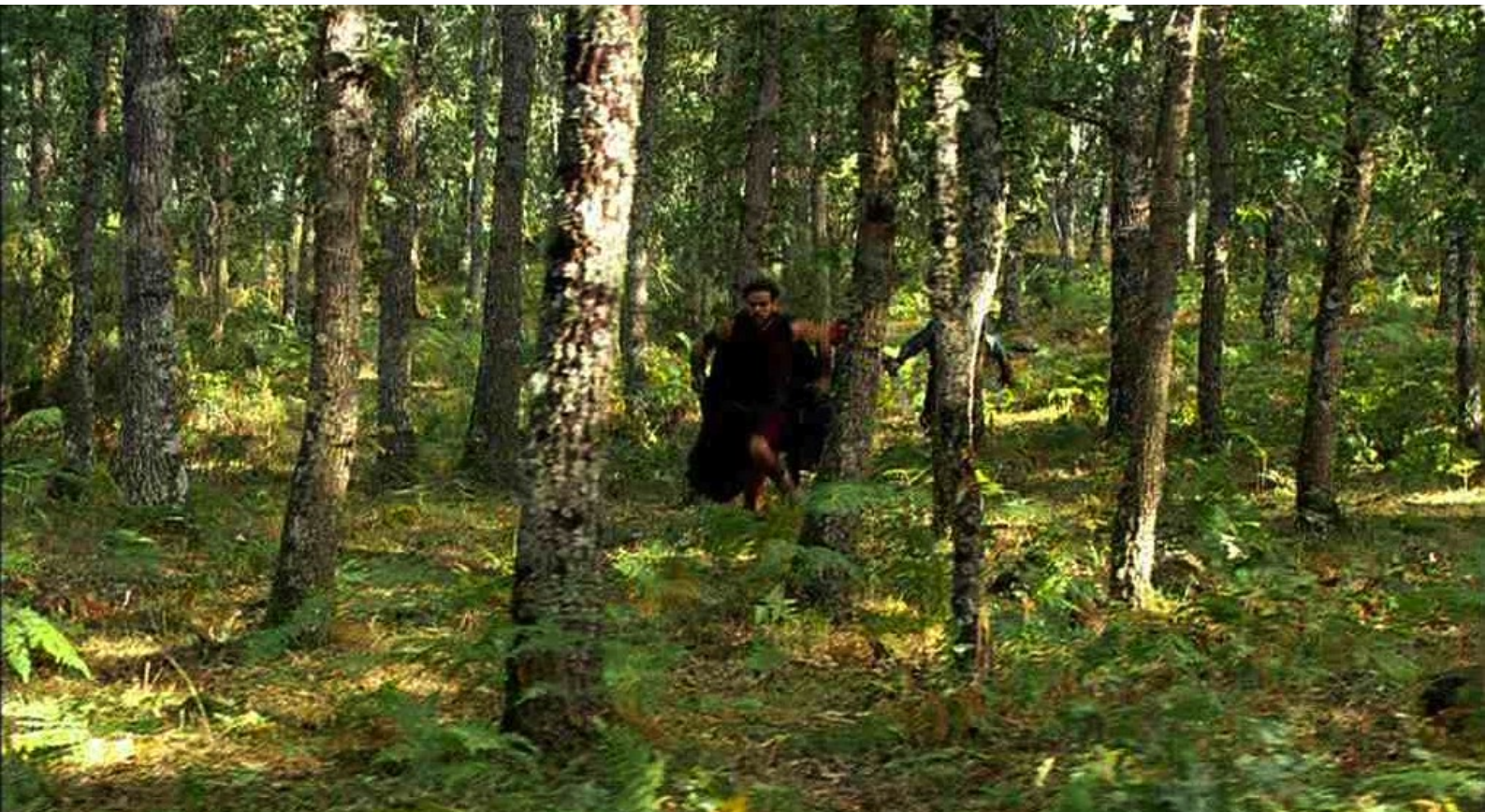
Hispania, la Leyenda : mais Viriate s'enfuit,