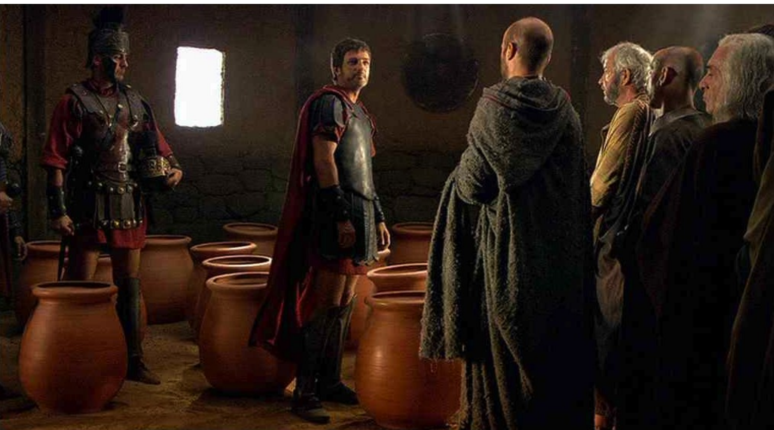
Hispania, la Leyenda : des amphores sont fournies aux Romains,