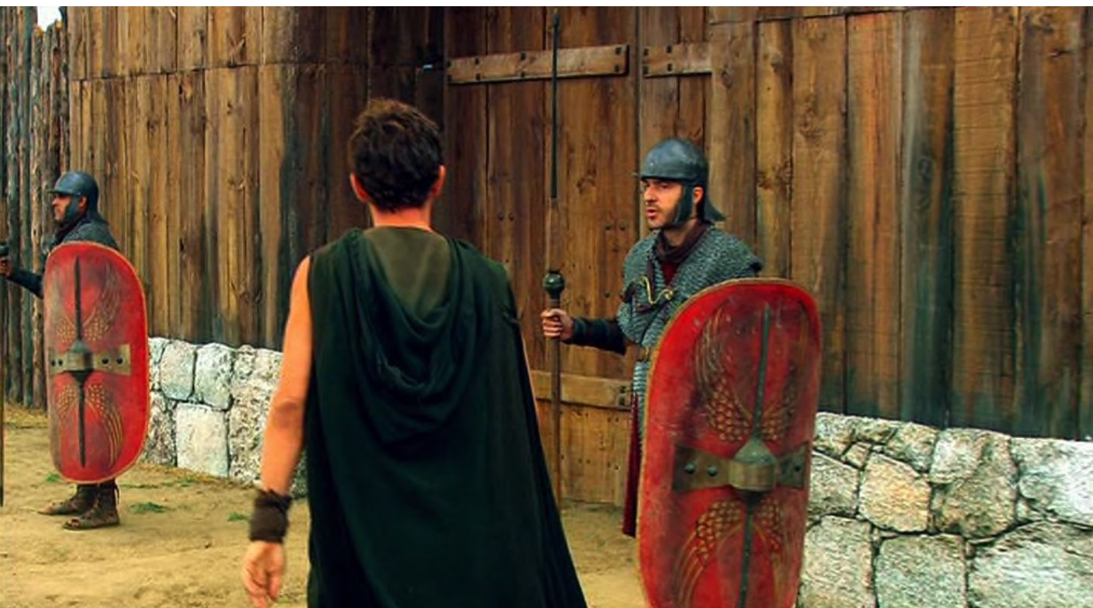
Hispania, la Leyenda : Pour avoir une récompense, Hector est allé dire à Galba...