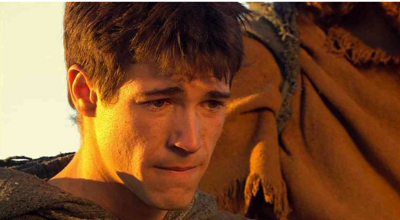
Hispania, la Leyenda : de Paulo...