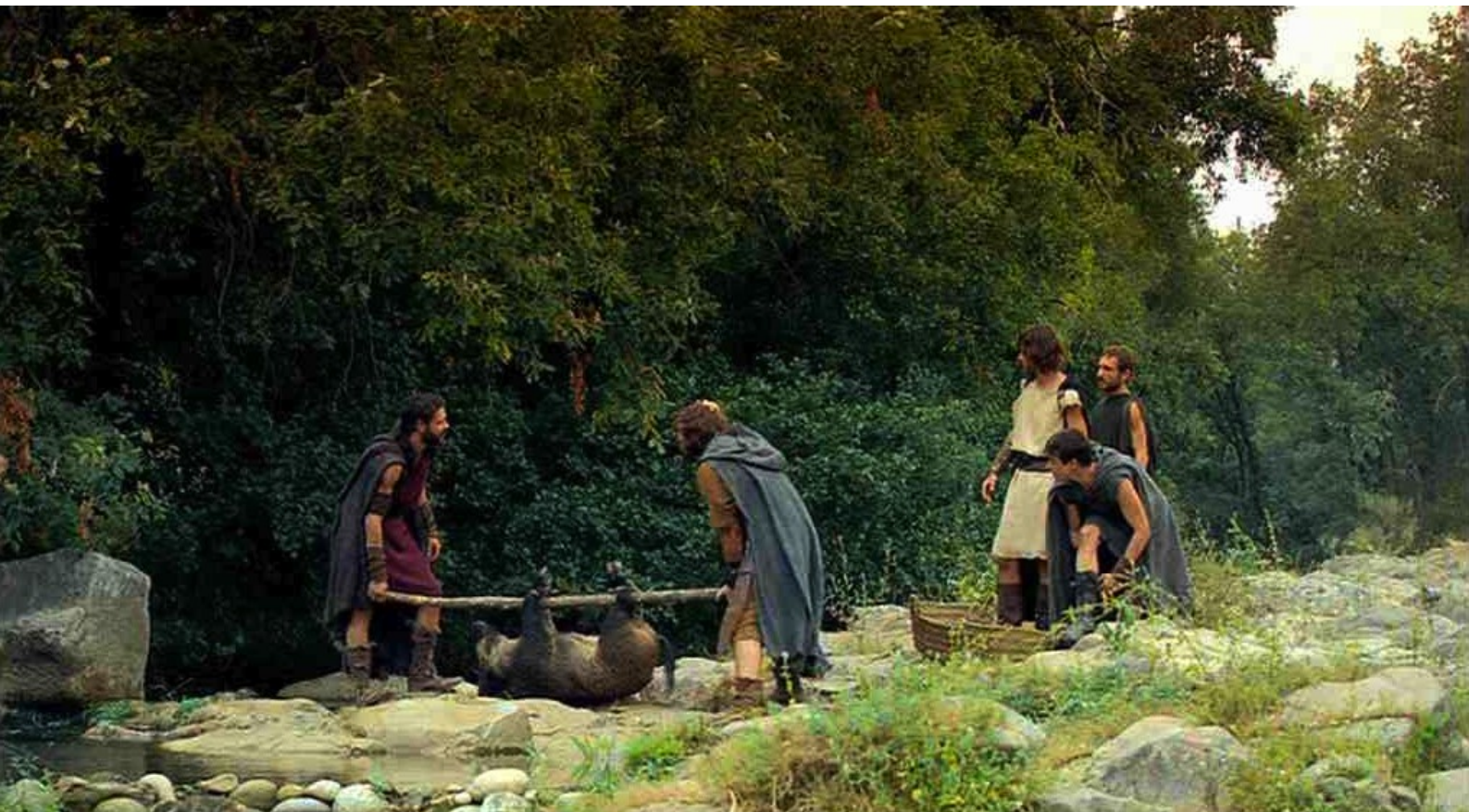
Hispania, la Leyenda : et jettent leurs cadavre dans la même rivière.