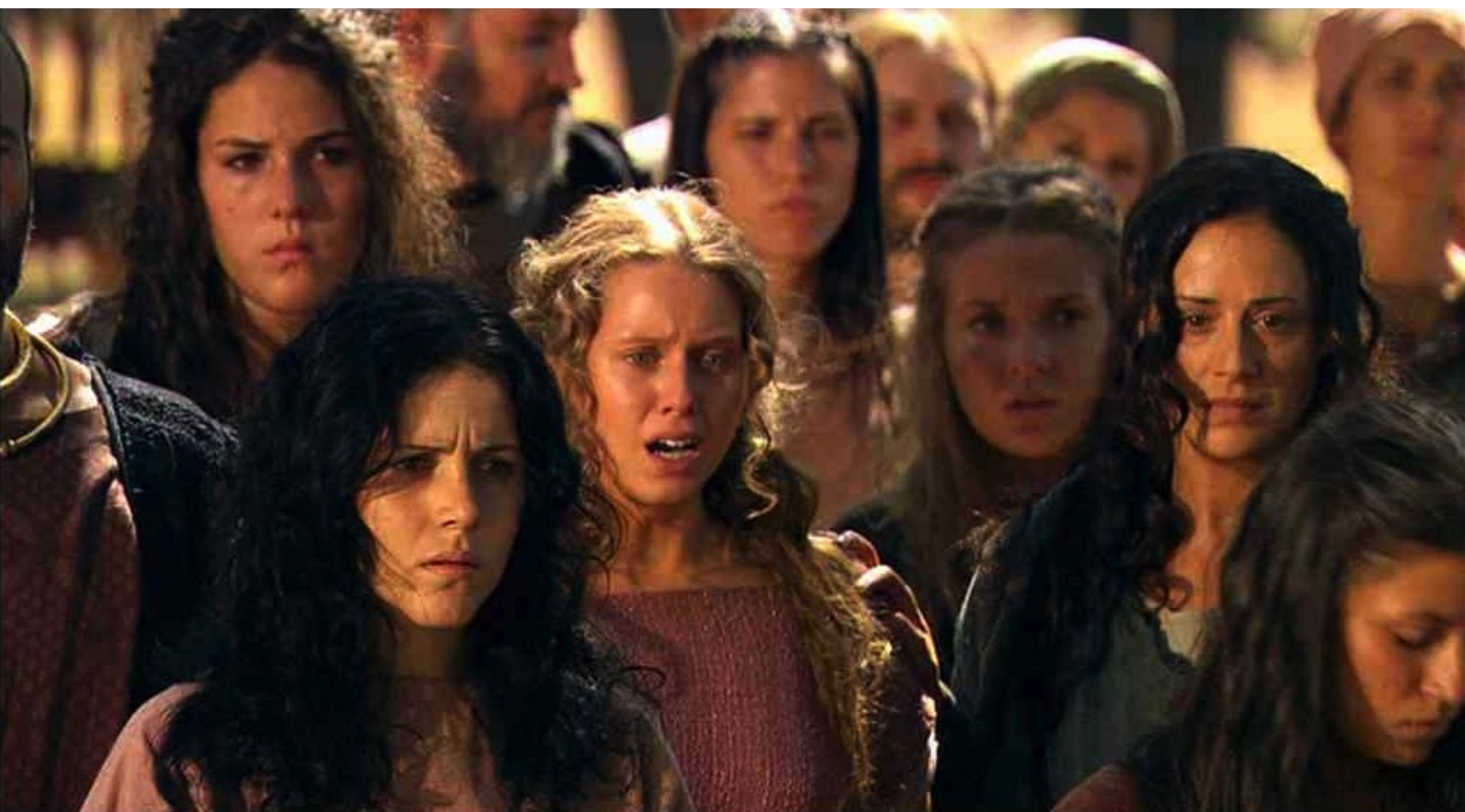
Hispania, la Leyenda : est désespérée face au cadavre de son bienaimé,