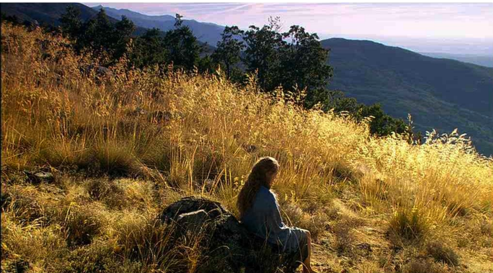
Hispania, la Leyenda : sur la Colline d'Or.