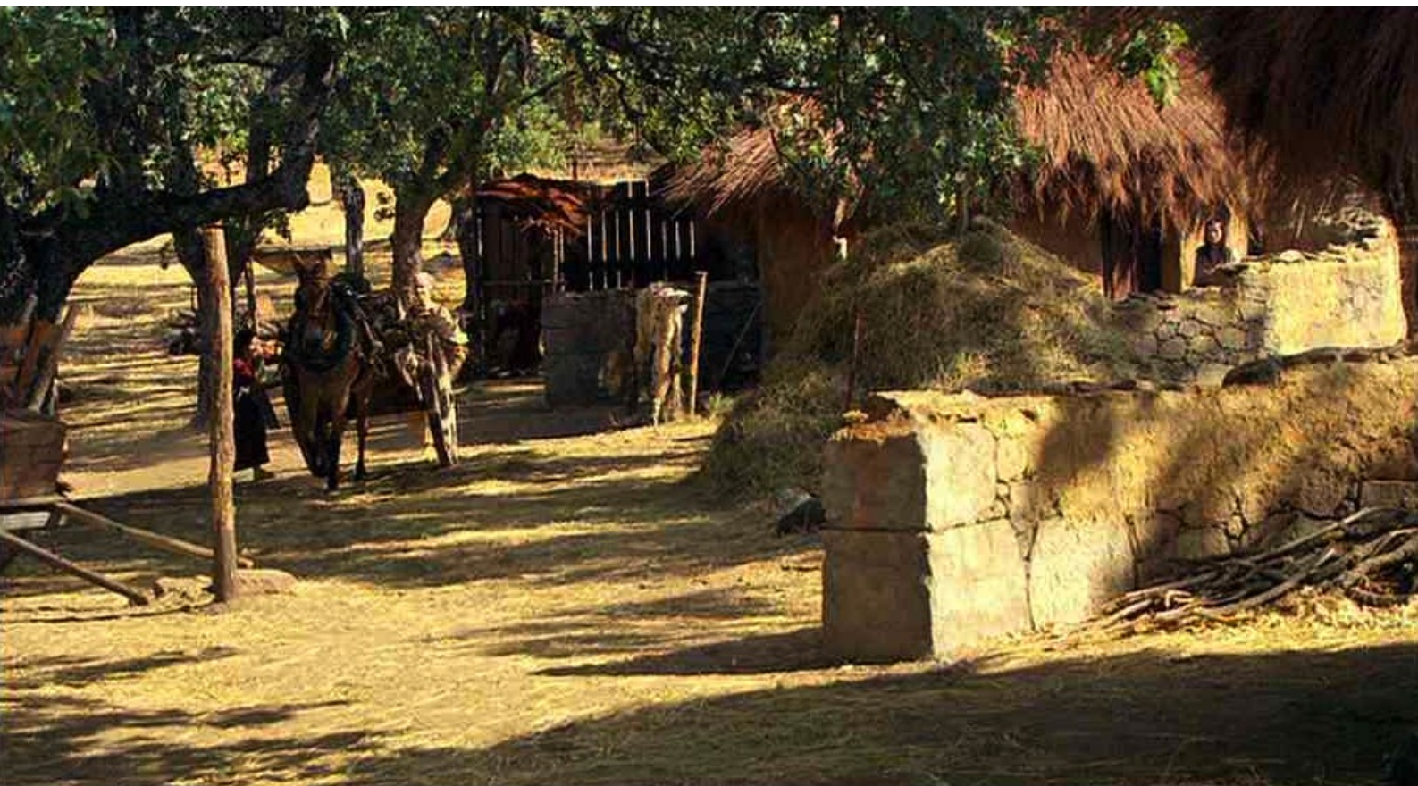
Hispania, la Leyenda : Ainsi les rebelles peuvent renvoyer de la nourriture à Caura.