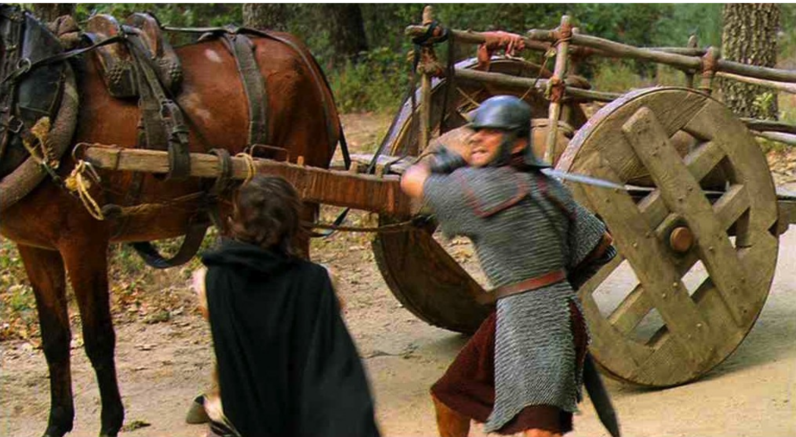
Hispania, la Leyenda : Alors Galba fait empoisonner le blé d'un convoi avec une faible escorte,