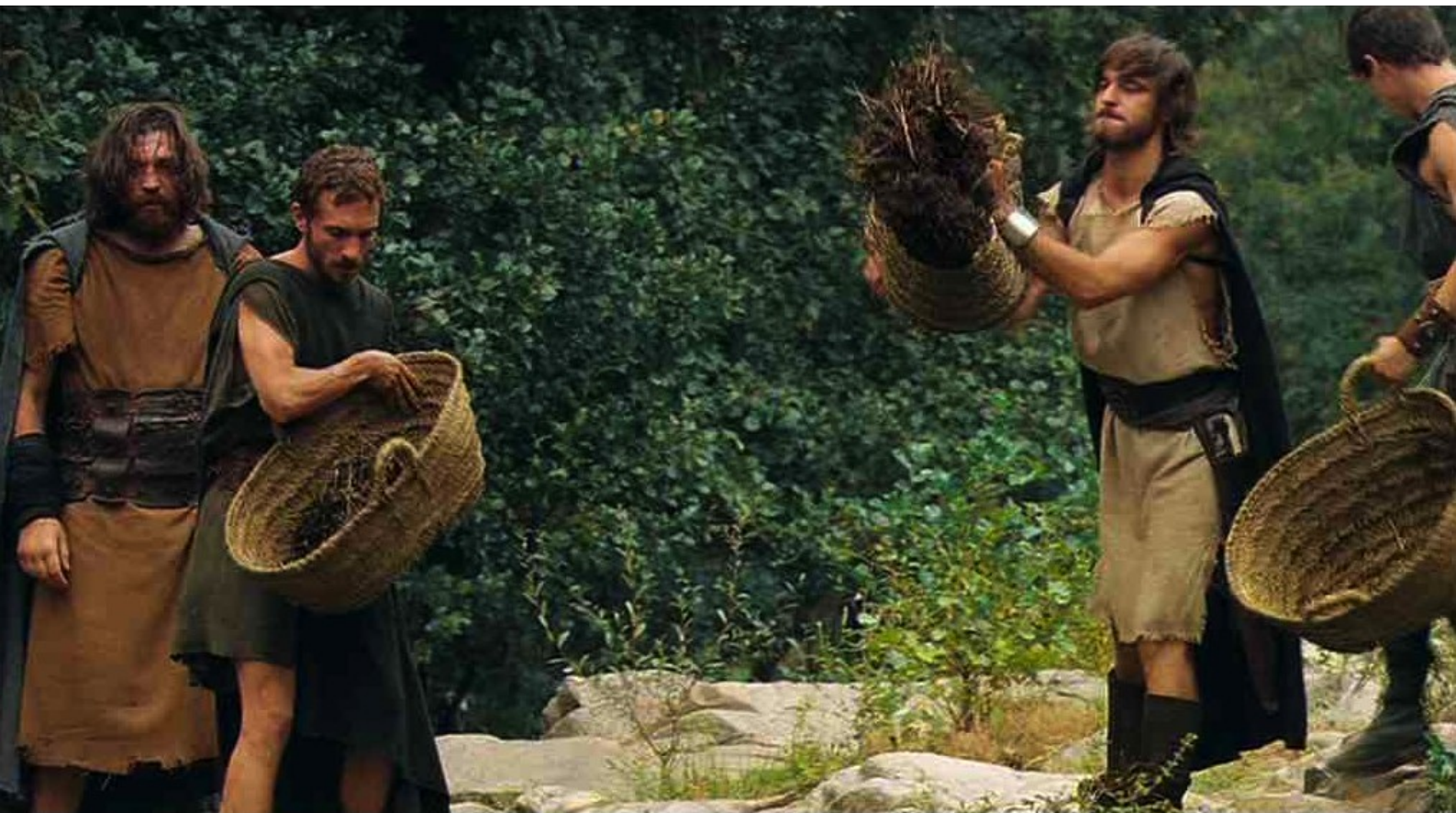
Hispania, la Leyenda : le jeter dans la rivière qui alimente en eau les puits des Romains ;