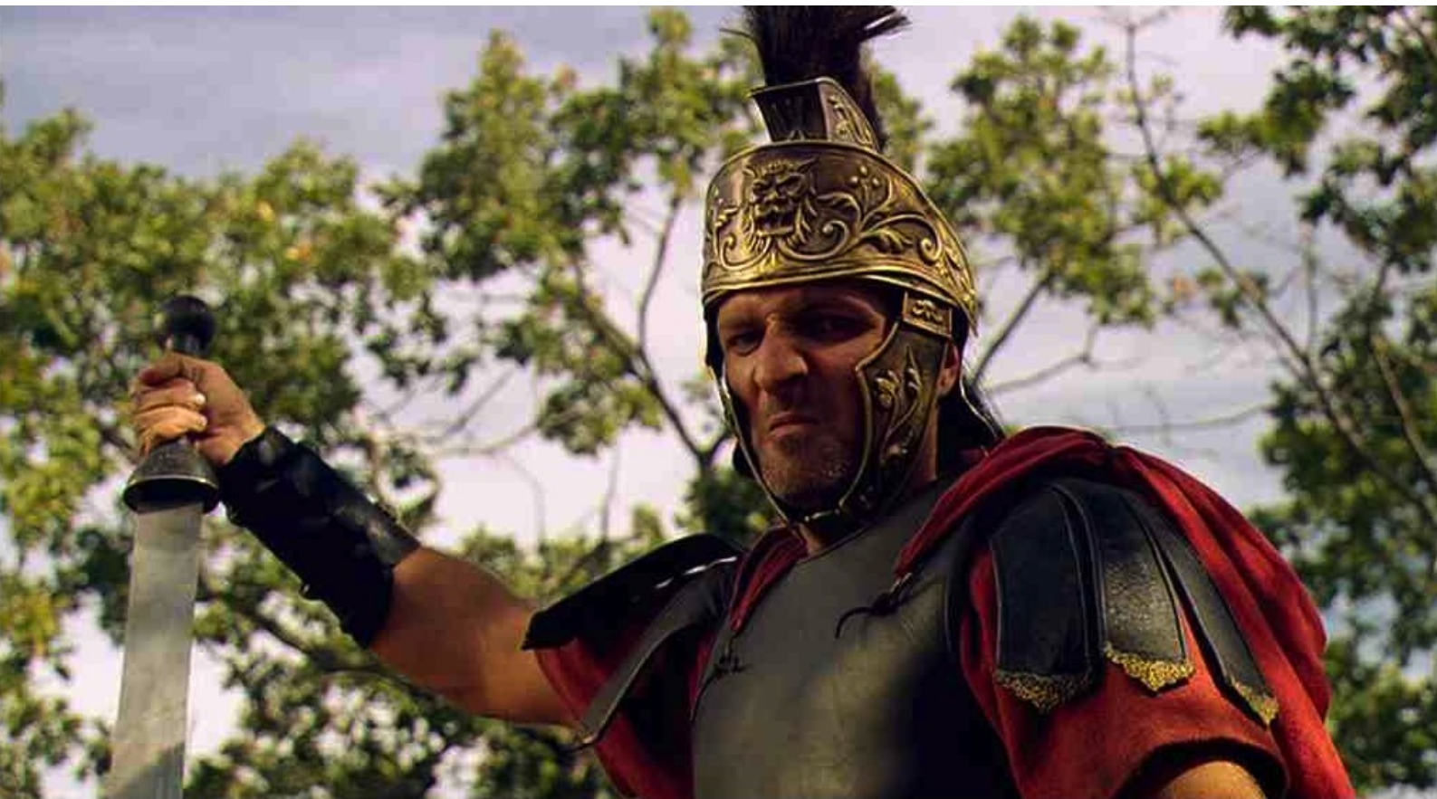
Hispania, la Leyenda : et, au moment où Marco croit pouvoir le tuer,