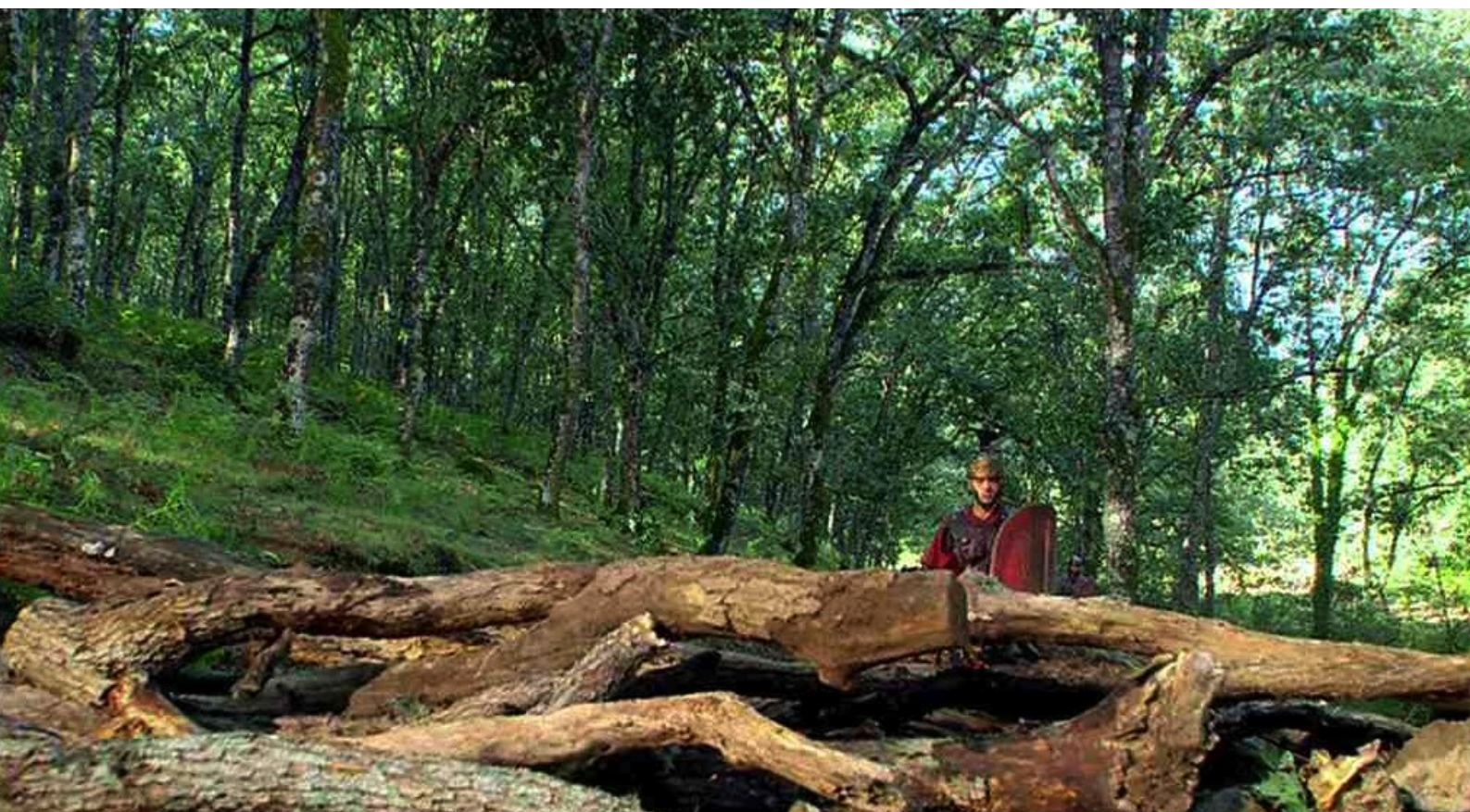
Hispania, la Leyenda : mais le convoi romain trouve la chaussée obstruée,