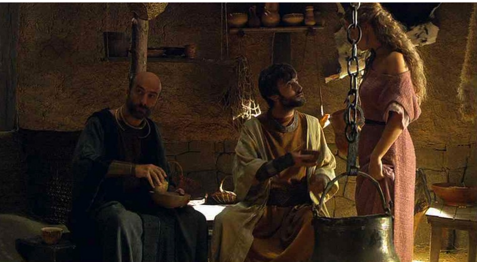
Hispania, la Leyenda : elle apprend que les fiançailles sont pour le lendemain,