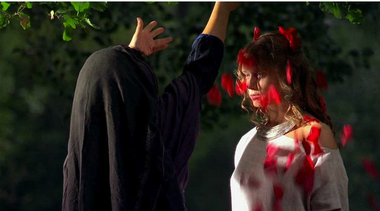
Hispania, la Leyenda : et parsemée de pétales rouges.