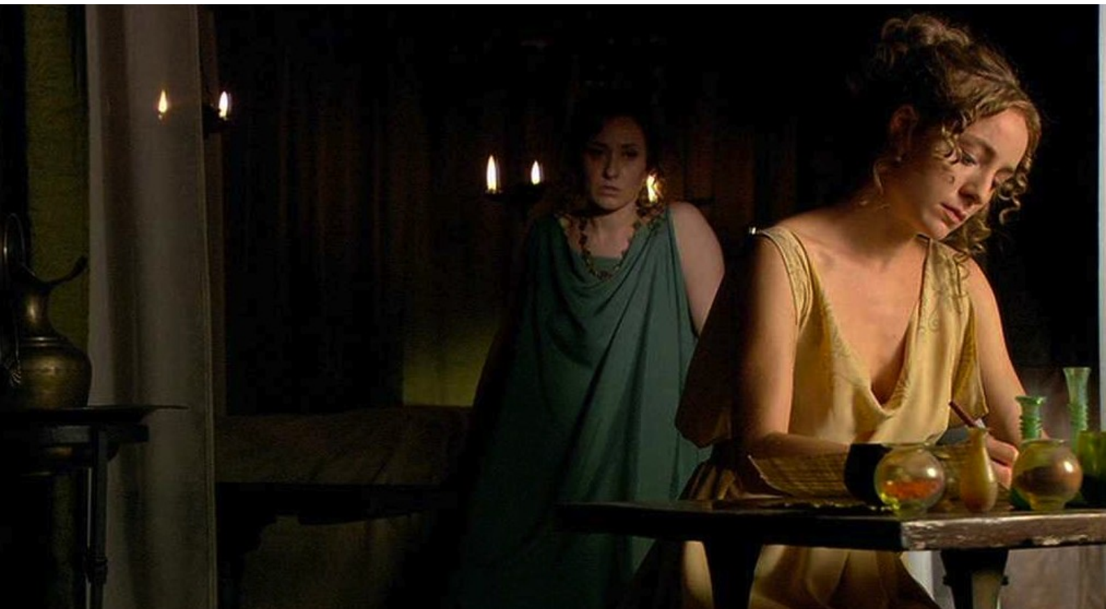
Hispania, la Leyenda : furieuse, elle écrit à son père sénateur de faire dégrader son mari,