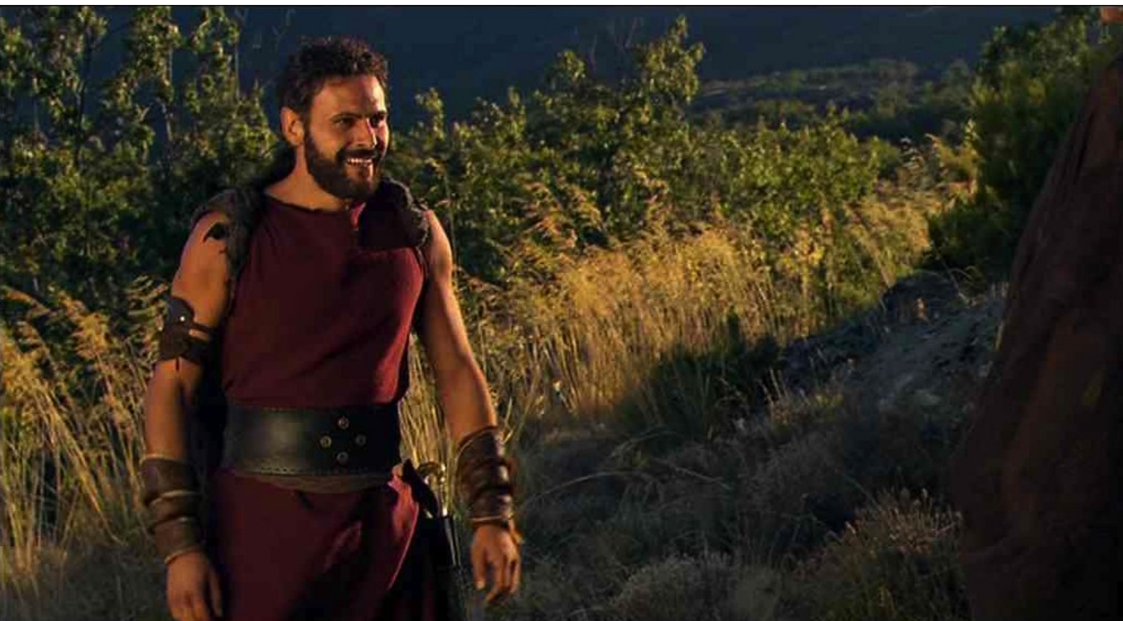
Hispania, la Leyenda : et de sourire quand elle arrivait.