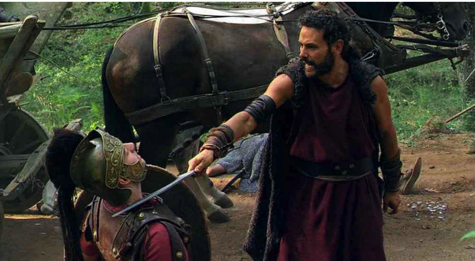
Hispania, la Leyenda : et le chef, menacé, doit abandonner les chars.