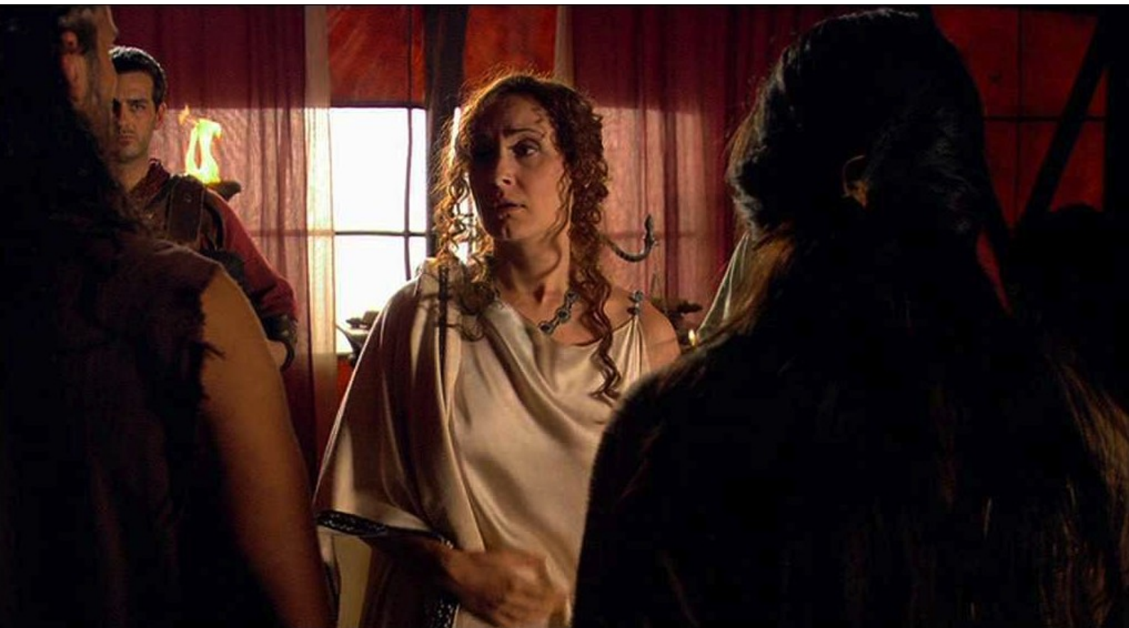
Hispania, la Leyenda : Claudia annonce que l'un d'eux est le chef des rebelles ;