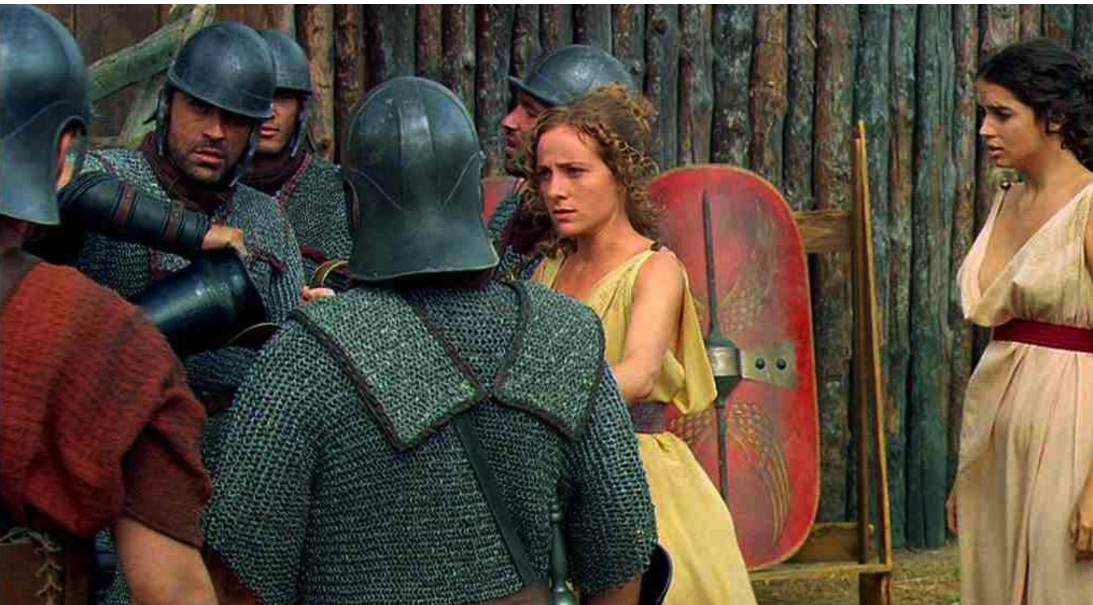
Hispania, la Leyenda : où la distribution d'eau est effectuée,