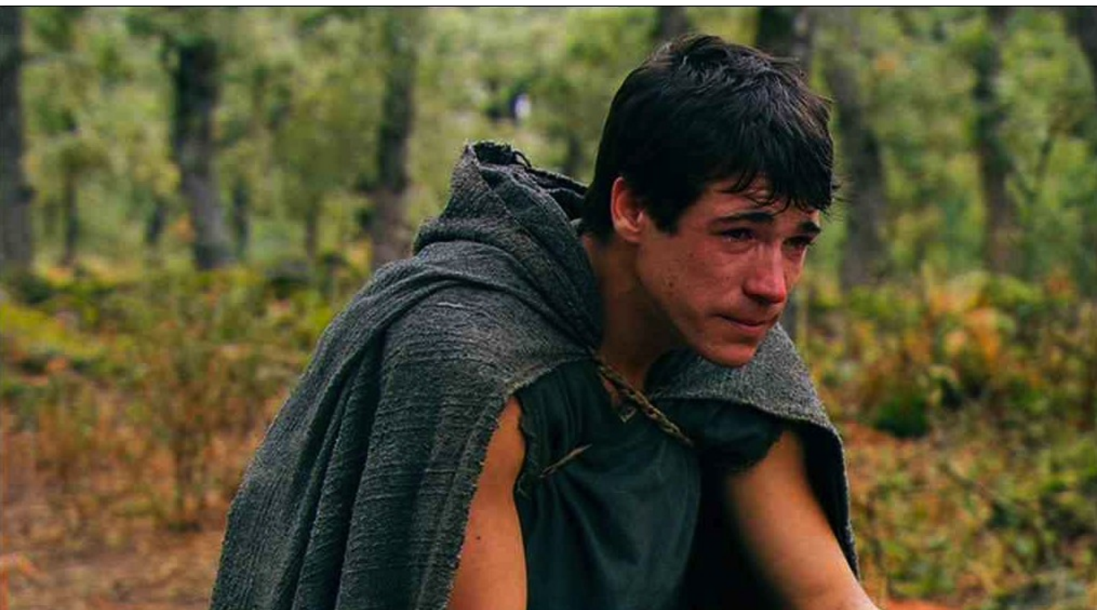
Hispania, la Leyenda : au désespoir de Paulo, dont la fiancée risque de mourir empoisonnée,