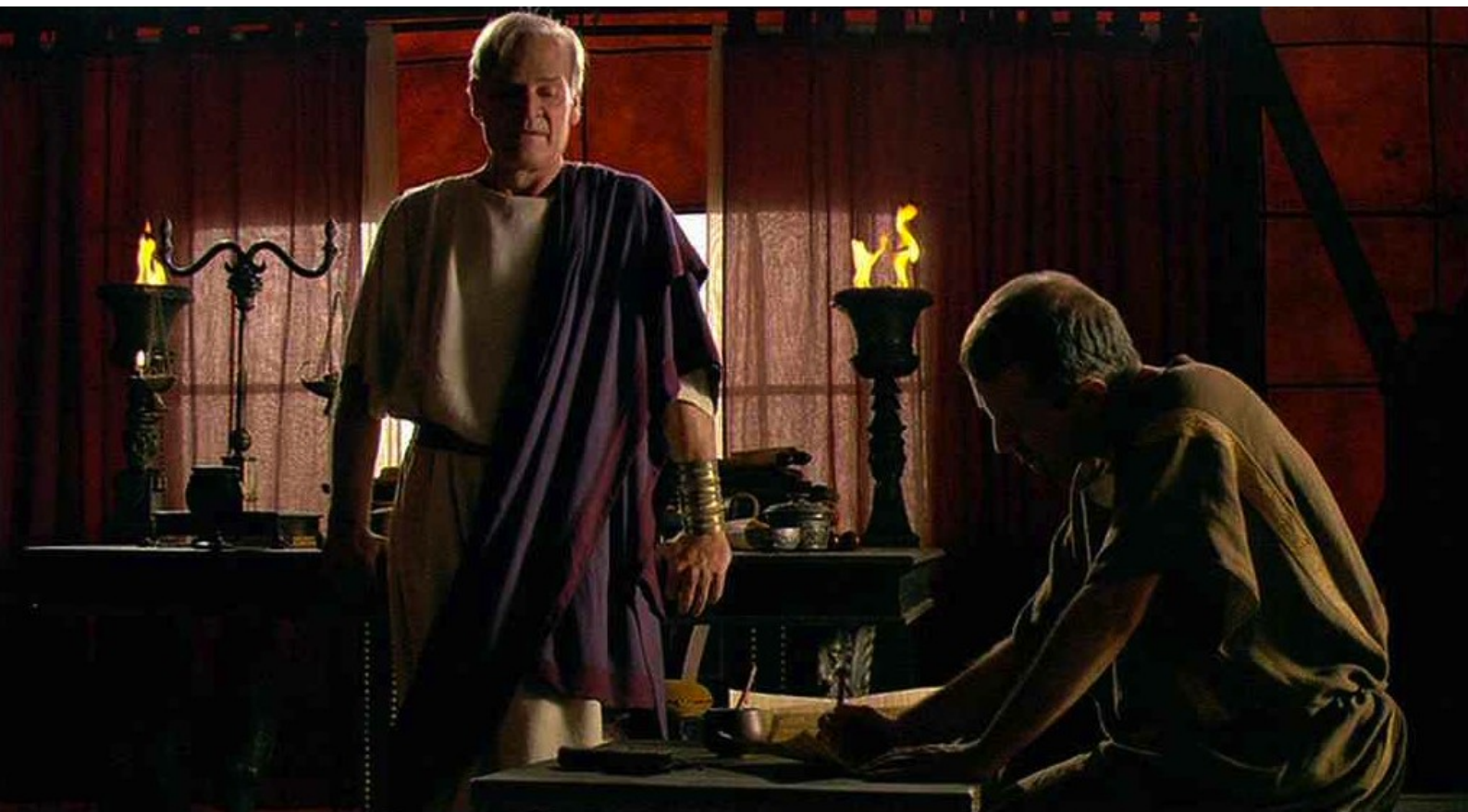
Hispania, la Leyenda : et Galba écrit à ses contacts à Rome de faire tuer son beau-père.