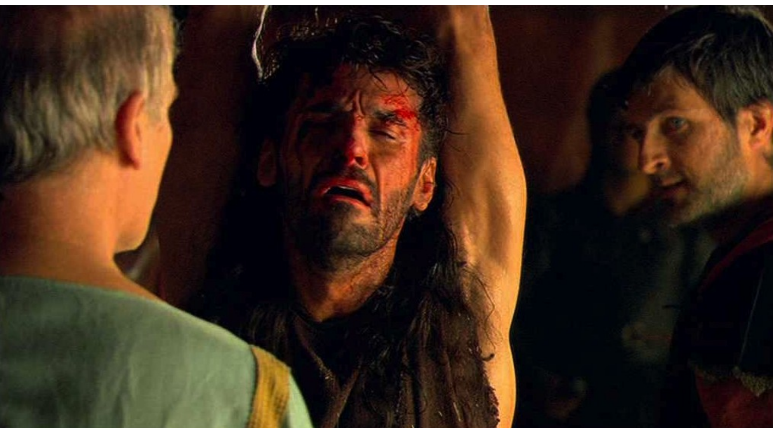
Hispania, la Leyenda : Galba le fait interroger, torturer,