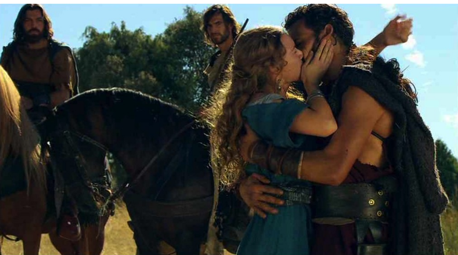
Hispania, la Leyenda : et ils se donnent leur tout premier baiser.