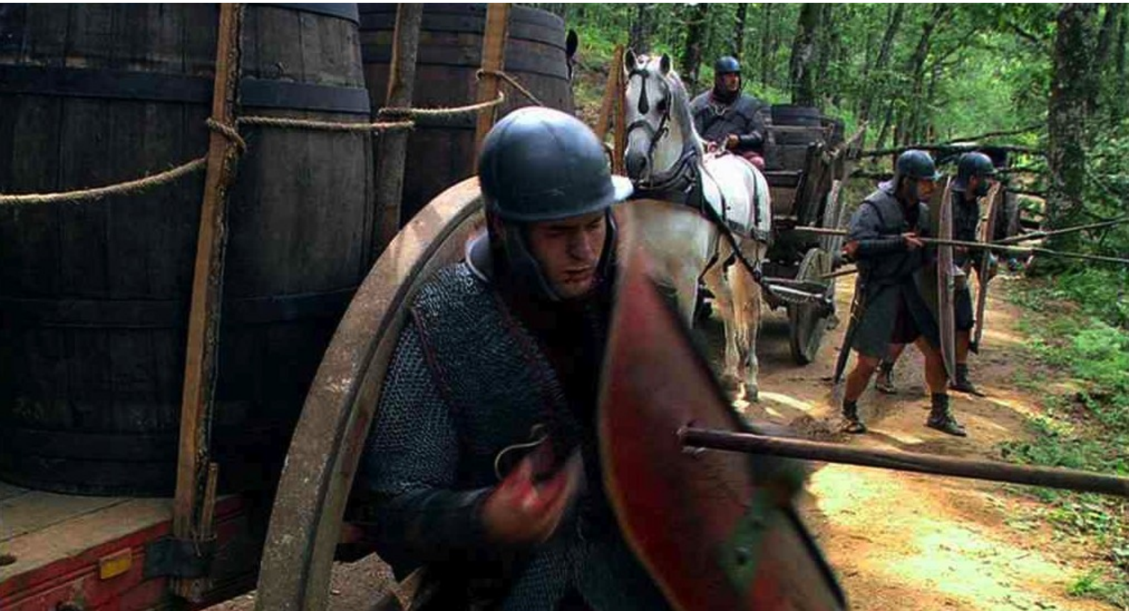
Hispania, la Leyenda : puis est brusquement attaqué...