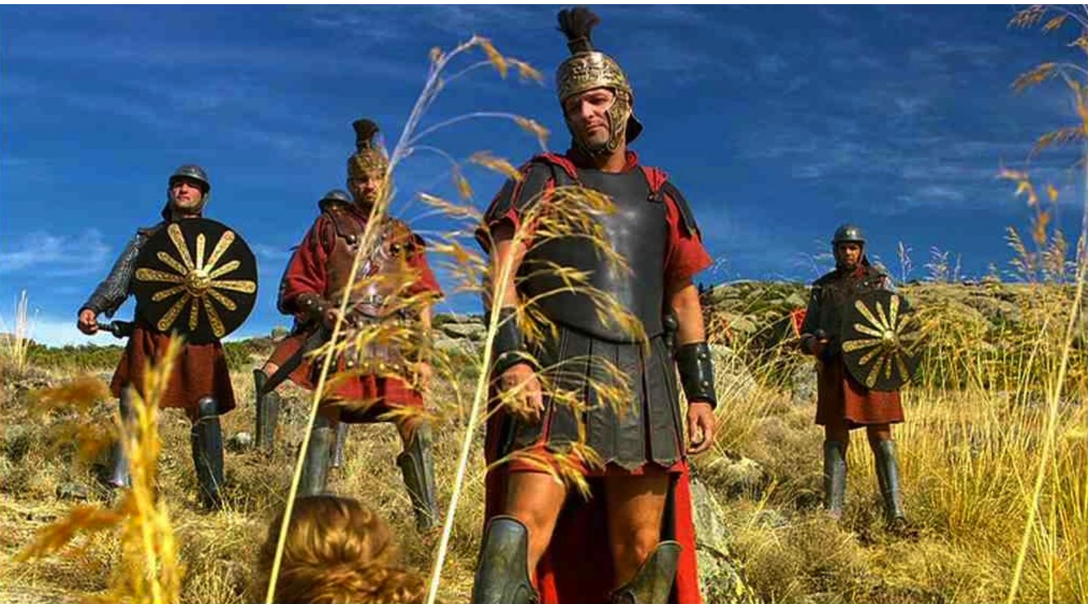
Hispania, la Leyenda : Marco va le piéger avec quelques hommes,