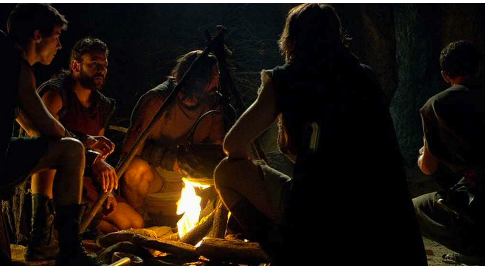
Hispania, la Leyenda : mais les rebelles voient juste à temps un rat mort d'avoir mangé de ce blé.