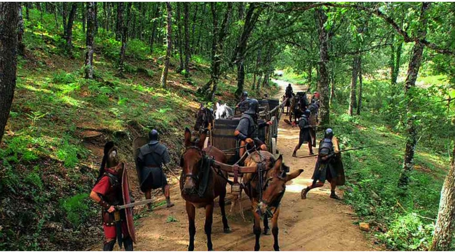
Hispania, la Leyenda : se met en position de défense,