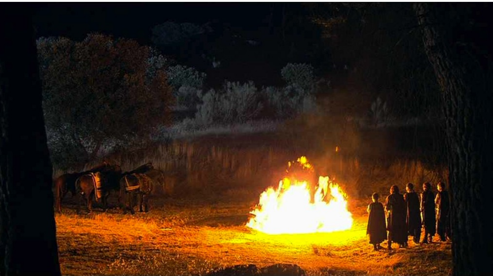
Hispania, la Leyenda : sous les yeux des villageois,