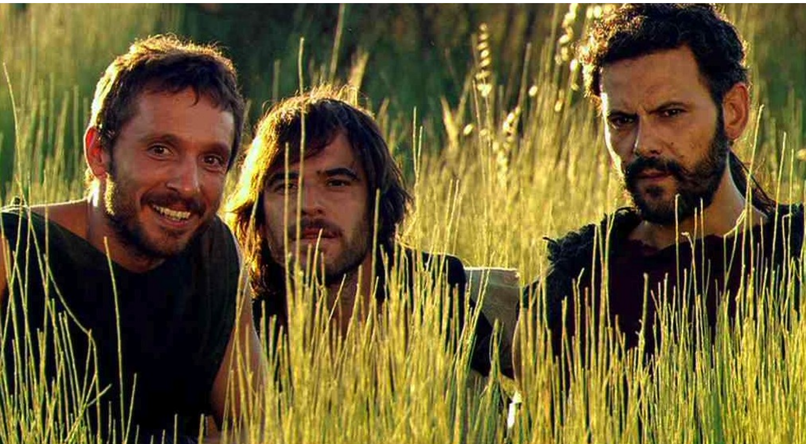
Hispania, la Leyenda : mais au grand plaisir des autres rebelles,