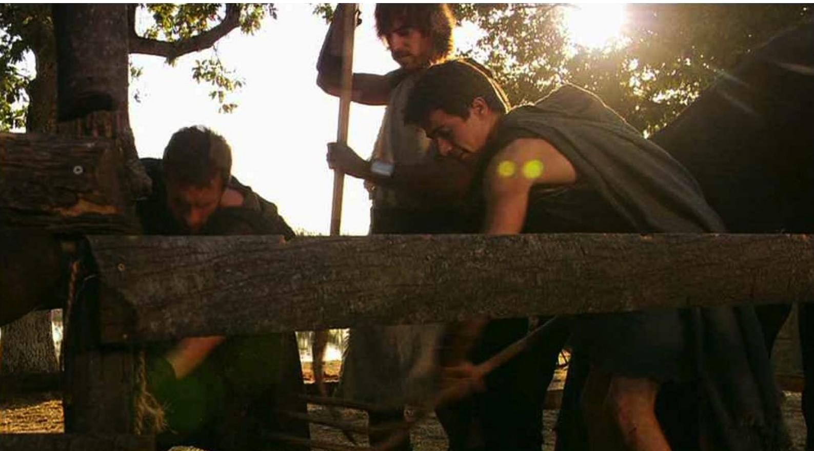
Hispania, la Leyenda : Pour incommoder les Romains, les rebelles recueillent du fumier de porc et vont...

Comme portfolios du numéro 46 de La 12 e Heure , nous vous offrons plusieurs florilèges de photos tirées des épisodes de la série Hispania, la Leyenda , à laquelle nous avons consacré le dossier du numéro 46 de notre fanzine.