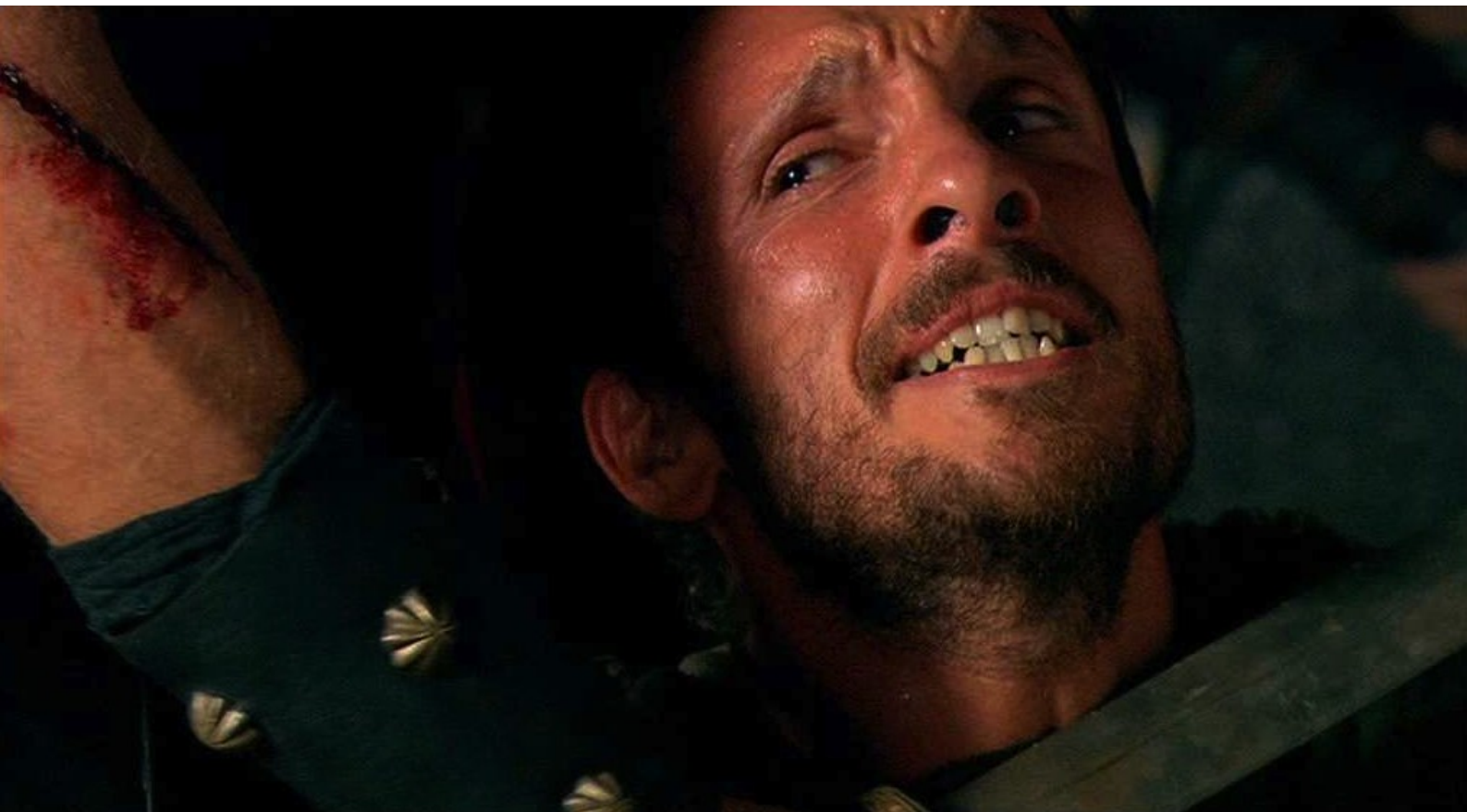
Hispania, la Leyenda : mais le traître, pour sauver sa vie, révèle à temps que l'eau est empoisonnée.