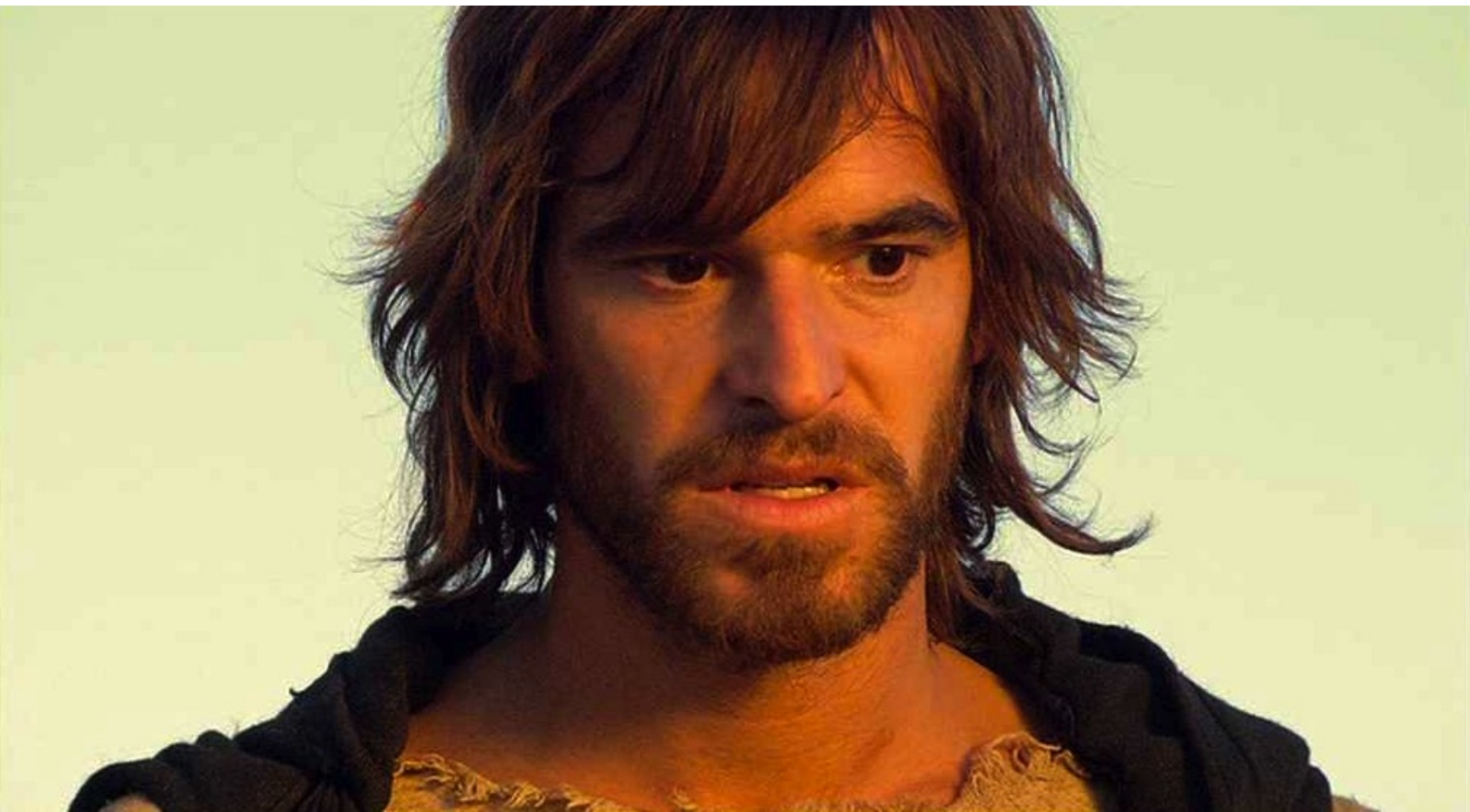
Hispania, la Leyenda : et de Dario.