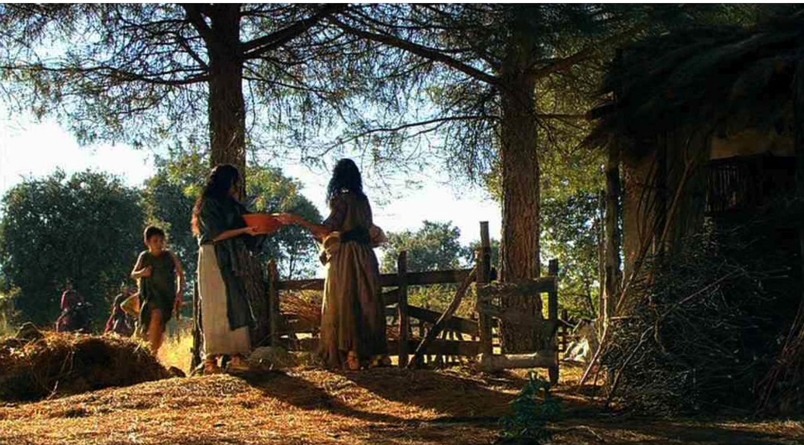
Hispania, la Leyenda : qui va l'apporter à une famille paysanne affamée...