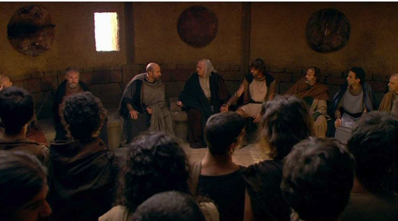
Hispania, la Leyenda : Mais, sur décision du conseil des notables,