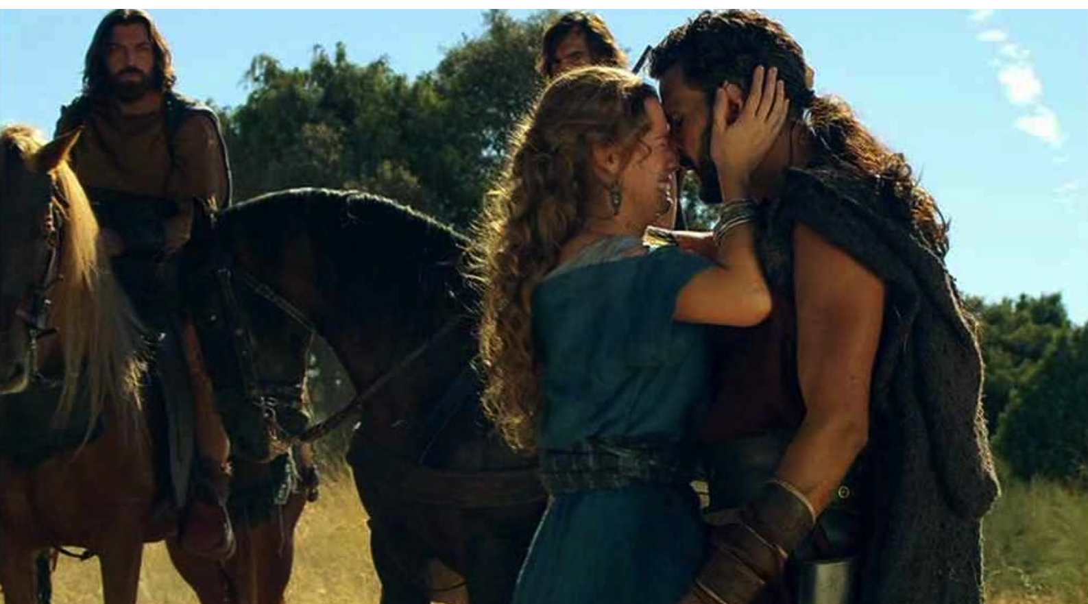
Hispania, la Leyenda : Helena est surprise et heureuse de retrouver Viriate vivant,