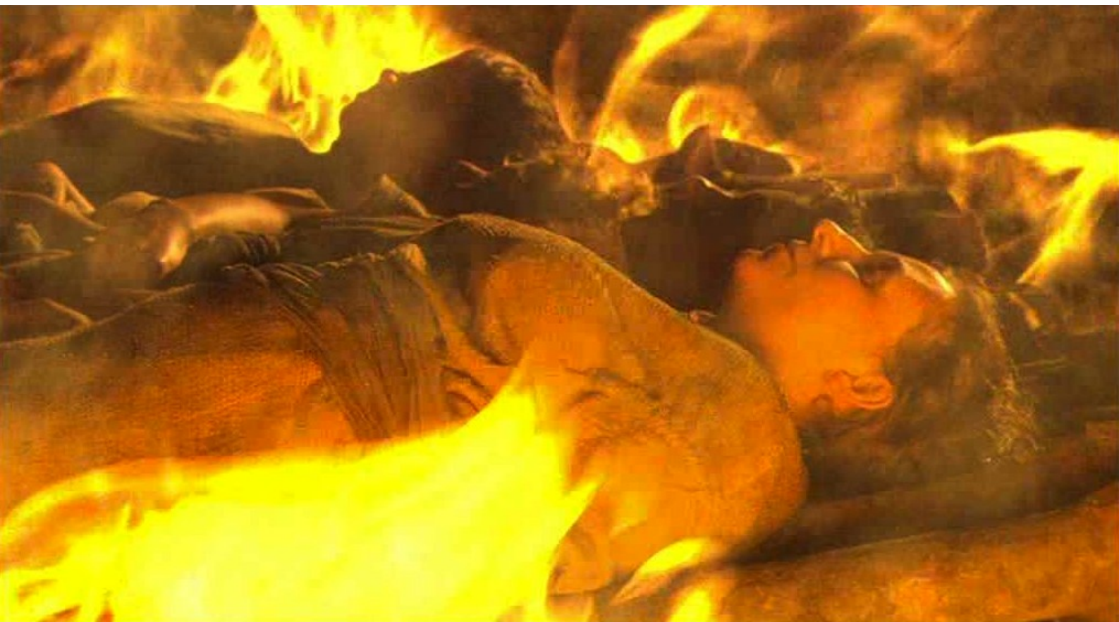
Hispania, la Leyenda : Alors on brûle les corps...