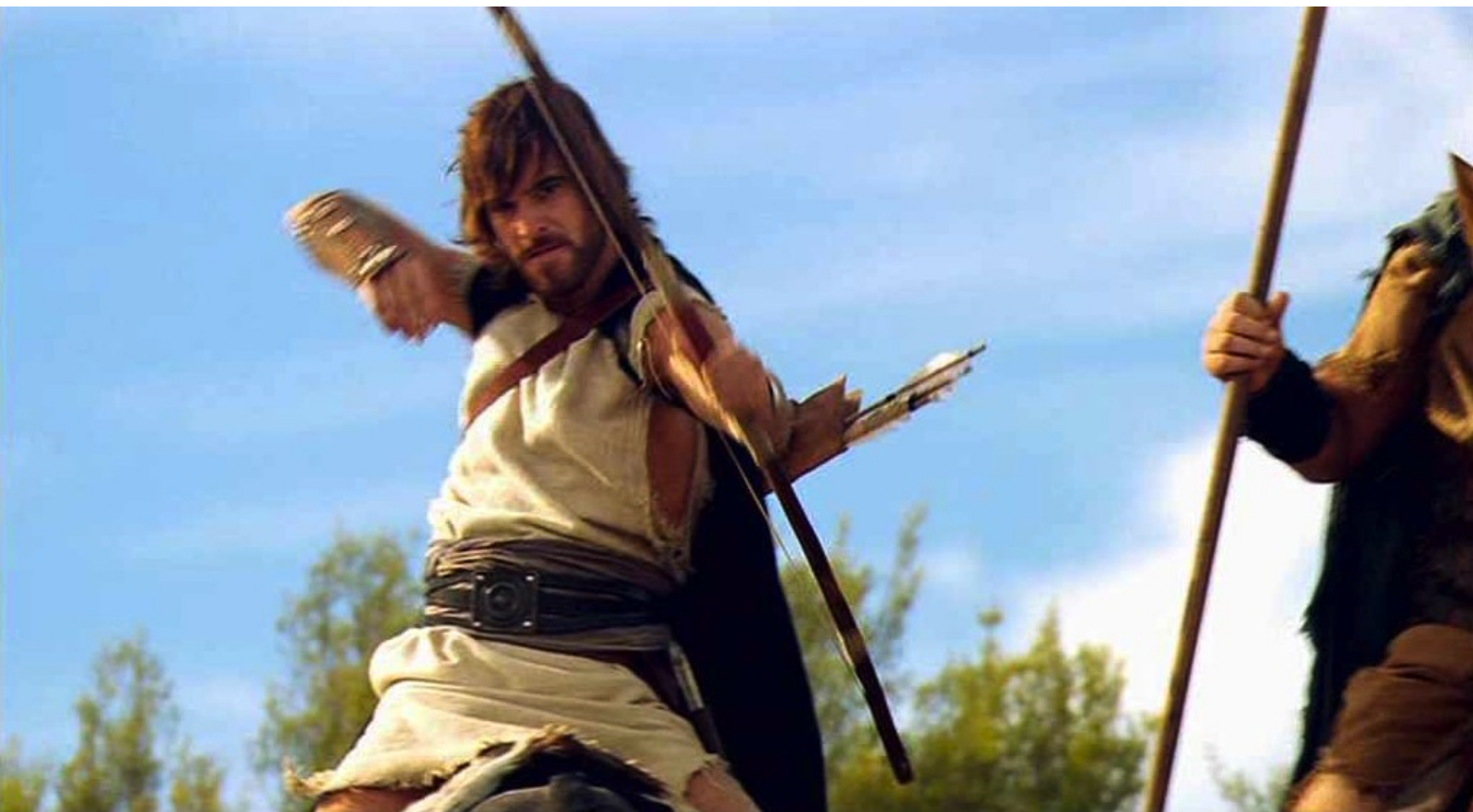
Hispania, la Leyenda : il reçoit une flèche tirée par Dario...