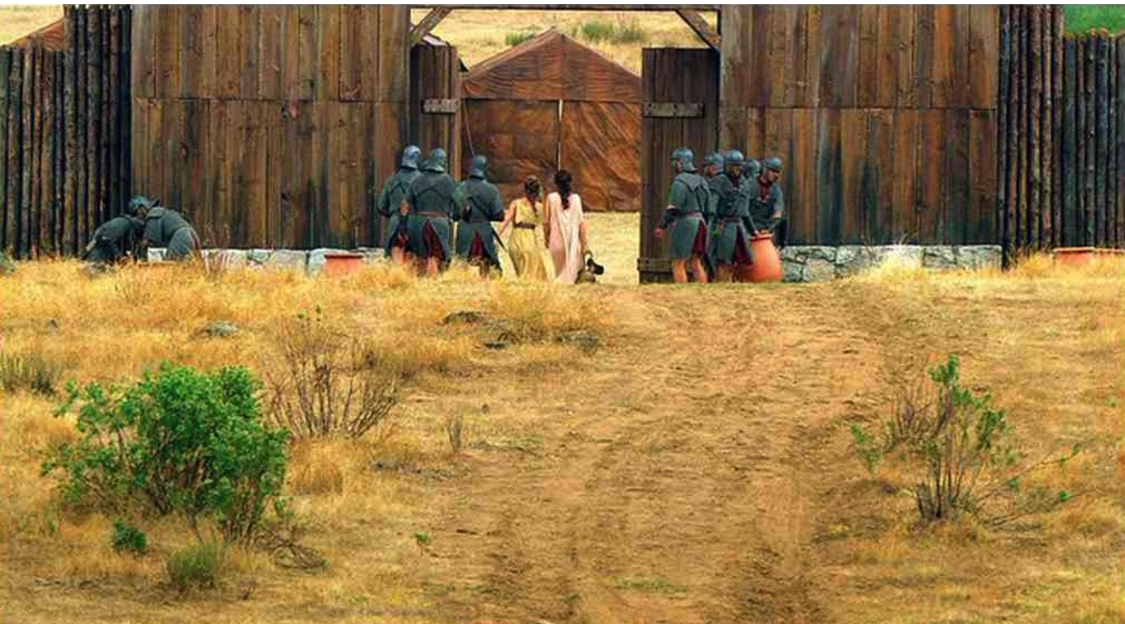
Hispania, la Leyenda : et Nerea est sauvée.