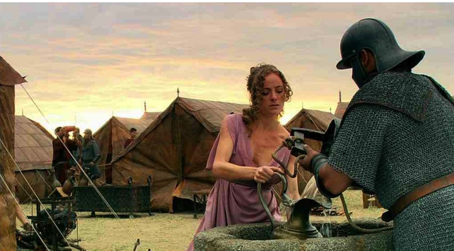
Hispania, la Leyenda : y compris à Sabina pour le compte de Galba,