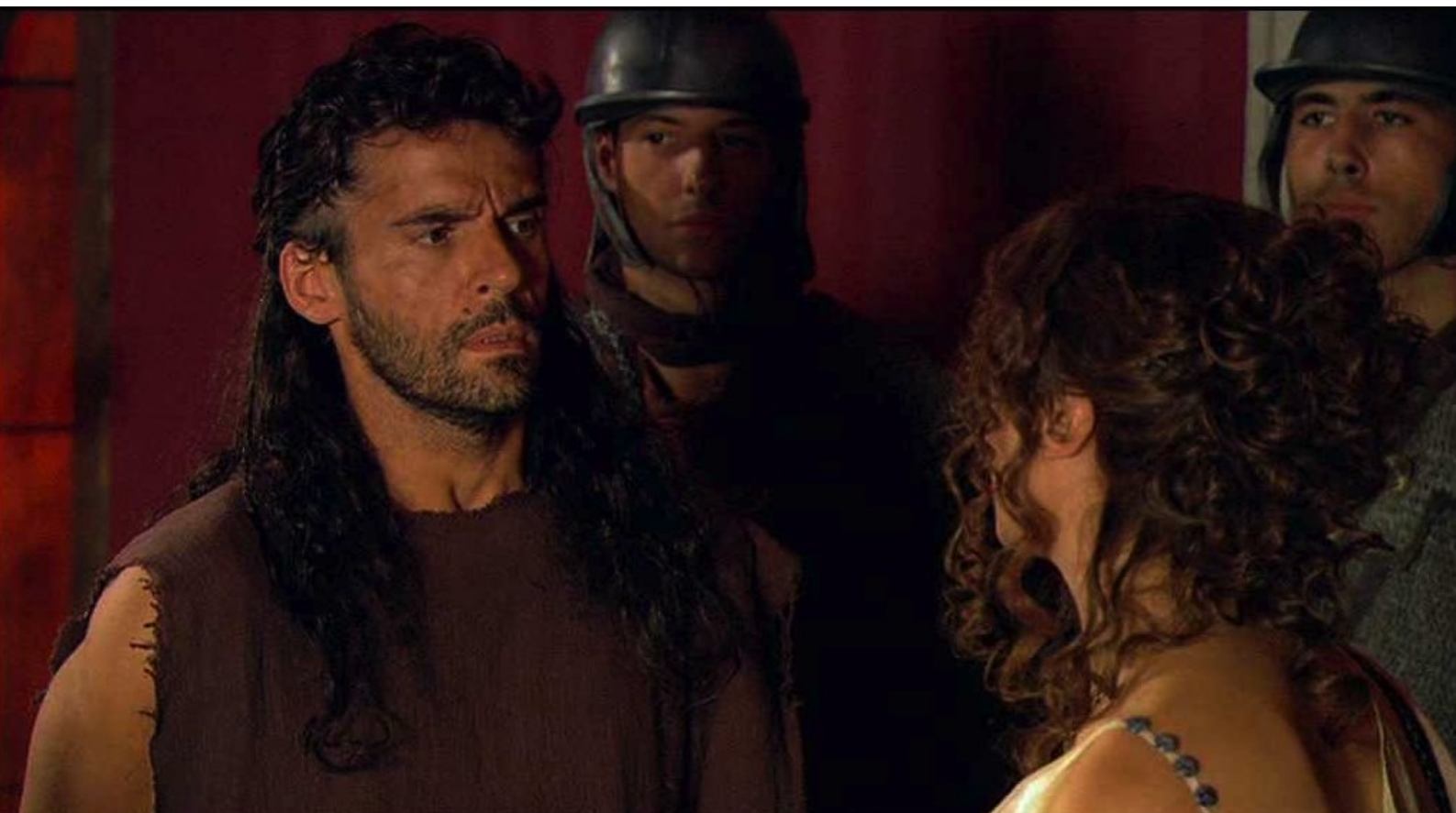
Hispania, la Leyenda : Puis, les Romains ayant capturé deux bergers lusitaniens,