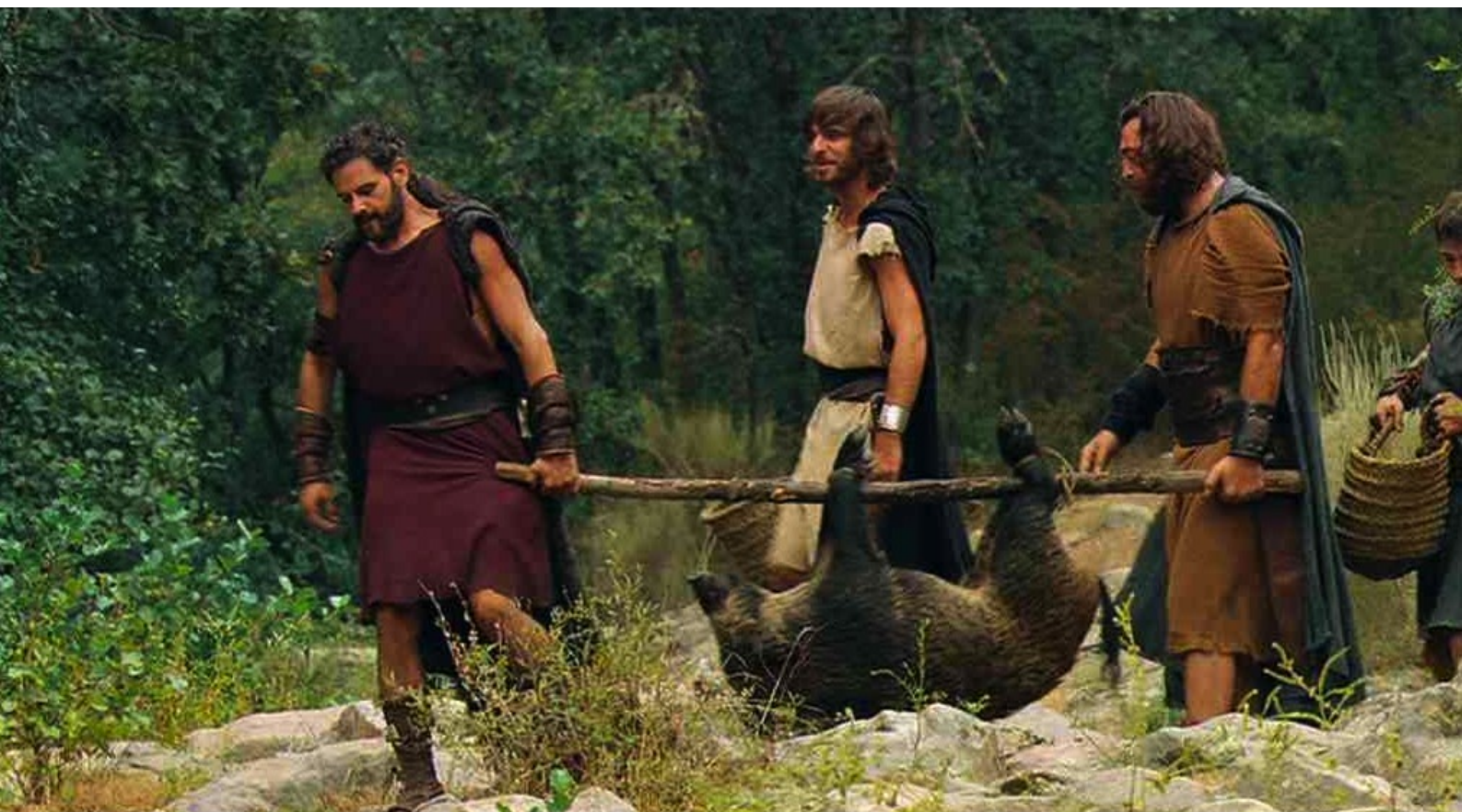
Hispania, la Leyenda : de même, ils tuent des sangliers...