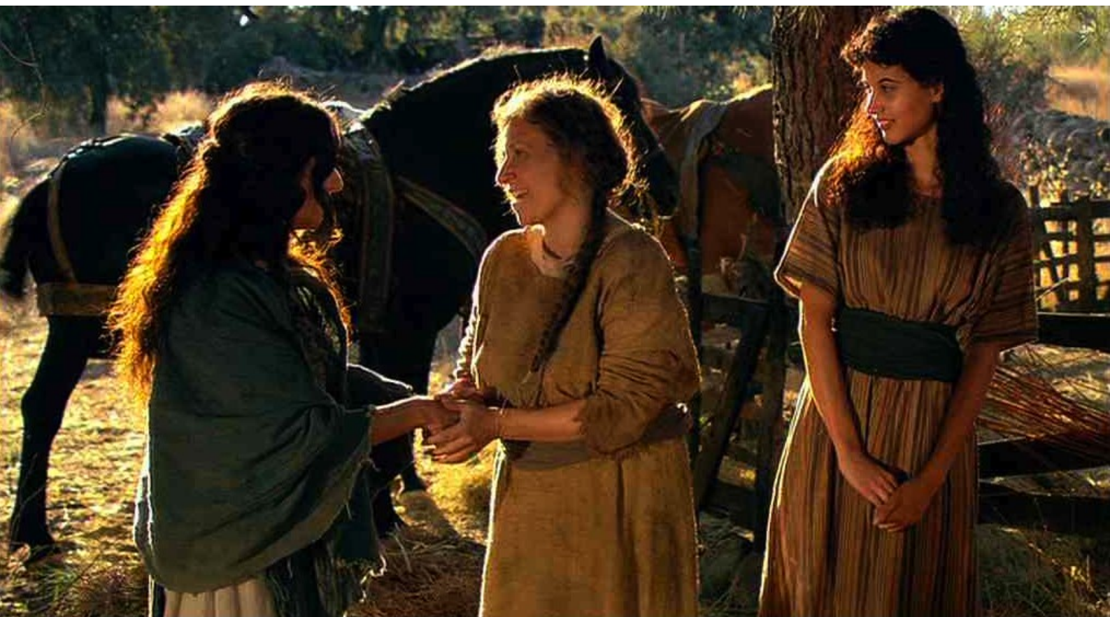
Hispania, la Leyenda : très reconnaissante.