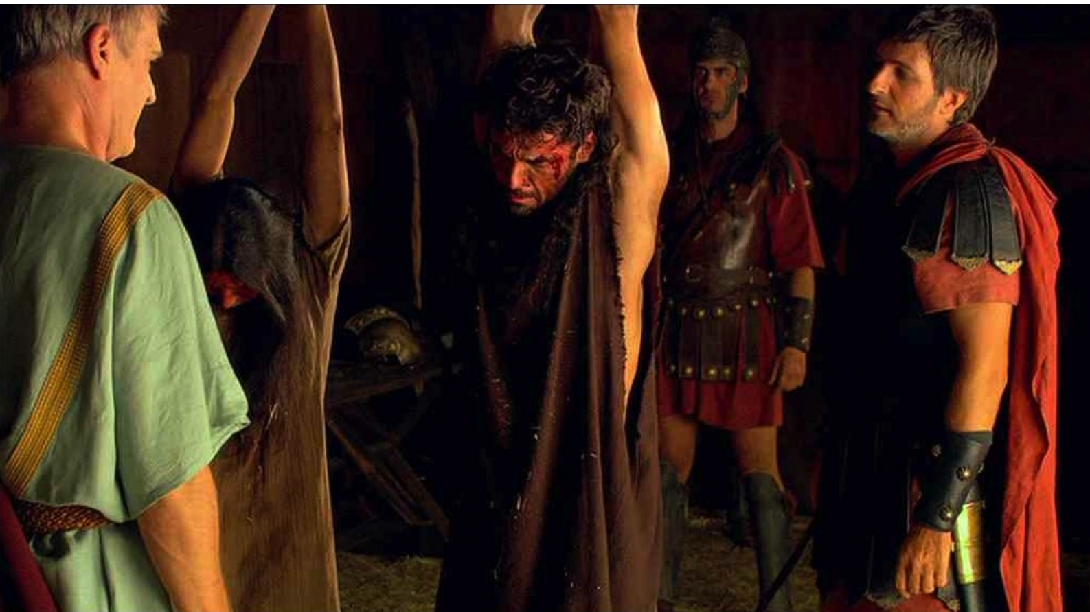
Hispania, la Leyenda : exécuter, défigurer,