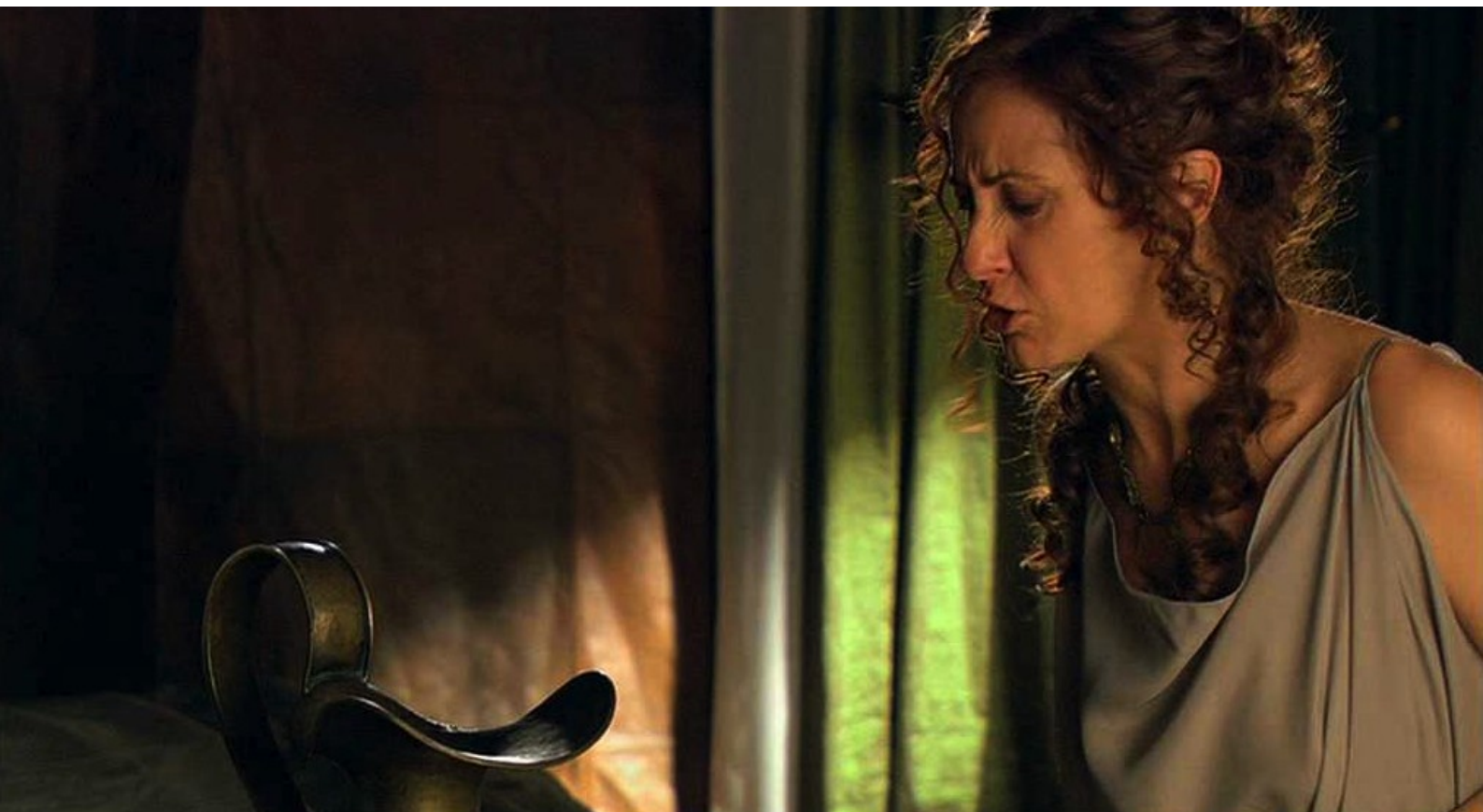
Hispania, la Leyenda : L'eau du camp étant devenue fétide,