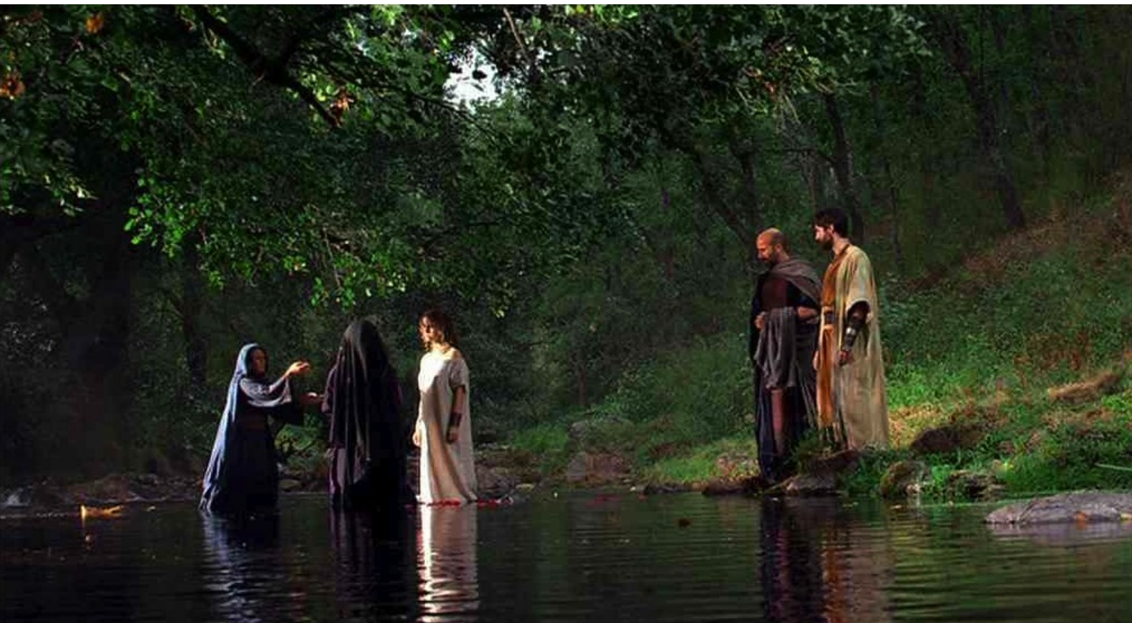
Hispania, la Leyenda : et que, au bord de la rivière,